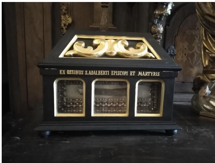
Ryc. 3. Relikwiarz św. Wojciecha w zakrystii kościoła klasztorowego św. Wojciecha w Broumowie