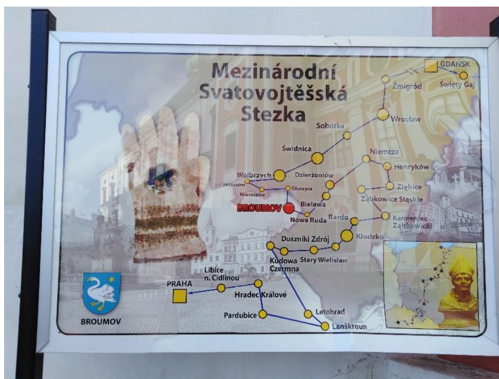
Ryc. 2. Wygląd tablicy oznakowania Międzynarodowego Szlaku Św. Wojciecha znajdującej się na terenie klasztoru św. Wojciecha w Broumowie, Republika Czeska

Powstający Szlak nie jest pierwszą tego rodzaju atrakcją turystyczną, jaka wyznaczona została z inicjatywy działaczy społecznych ziemi kłodzkiej. Wśród istniejących tras należy wymienić dwie poświęcone miejscom związanym z życiem lokalnych postaci wpisanych w wielokulturową historię regionu. Pasjonaci turystyki mogą wyruszyć szlakiem przedwojennego mieszkańca Kłodzka bł. ks. Gerharda Hirschfeldera, prowadzącym przez miejsca związane z życiem duchownego z Kłodzka poprzez Wambierzyce do Kudowy-Czermne, dalej przez Wambierzyce, Radków, Karlów [Fitych 2018, s. 28]. W 2012 r. z kolei oznakowano szlak kulturowy teologa, prof. Josepha Wittiga, który w swojej twórczości określał ziemię kłodzką mianem „krajny cudów, krajny Pana Boga”. Prowadzi on z Nowej Rudy do sanktuarium na Górze św. Anny i Matki Bożej Bolesnej na Górze Wszystkich Świętych, poprzez punkty widokowe Gór Sowich, Stołowych, Bardzkich, Masywu Śnieżnika i Karkonoszy, Bardo, Wambierzyce, Nysę Kłodzką, Łądek-Zdrój i Nowy Gieraków [Szlak im. Prof. Josepha Wittiga, 2012, s. 2]. W Górach Żółtych istnieje także Szlak Kurierów Solidarności [Piotrowski, www.naszesusdety.pl, 13.02.2020]. Trasy te mają charakter lokalny.