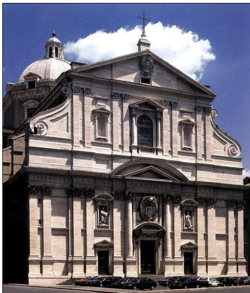
Ryc. 1. Kościół Il Gesu w Rzymie

narodowych), propaganda wizualna (teatr, widowiska, sztuki piękne), przymus wyznaniowy (prześladowanie heretyków przez powołaną inkwizycję oraz cenzurę druku). Orężem do realizacji tych zadań miał się stać powstały w 1540 roku zakon jezuitów (Towarzystwo Jezusowe) założony przez Ignacego Loyolę. Zakon skupiał się na szkolnictwie, wychowaniu młodzieży, nowych formach duszpasterskich, misjach na świecie, a nade wszystko nadał sztuce funkcję propagandową sięgając do tematyki średniowiecza, akcentując wyparte przez reformację wątki maryjne i hagiograficzne w sztuce. Kładł nacisk na rozbudowę i widowiskowość liturgii, teatralność wnętrza sakralnych, które miały dawać iluzję raju. Efekt niezwykłości, niebiańskości potęgowała muzyka organowa lub chóralna i woń kadzideł. Wzorcem dla wszystkich budowanych wówczas świątyń jezuitów był macierzysty rzymski kościół Il Gesu, którego rozwiązania architektoniczne ściśle odzwierciedlały nowe idee Kościoła katolickiego.