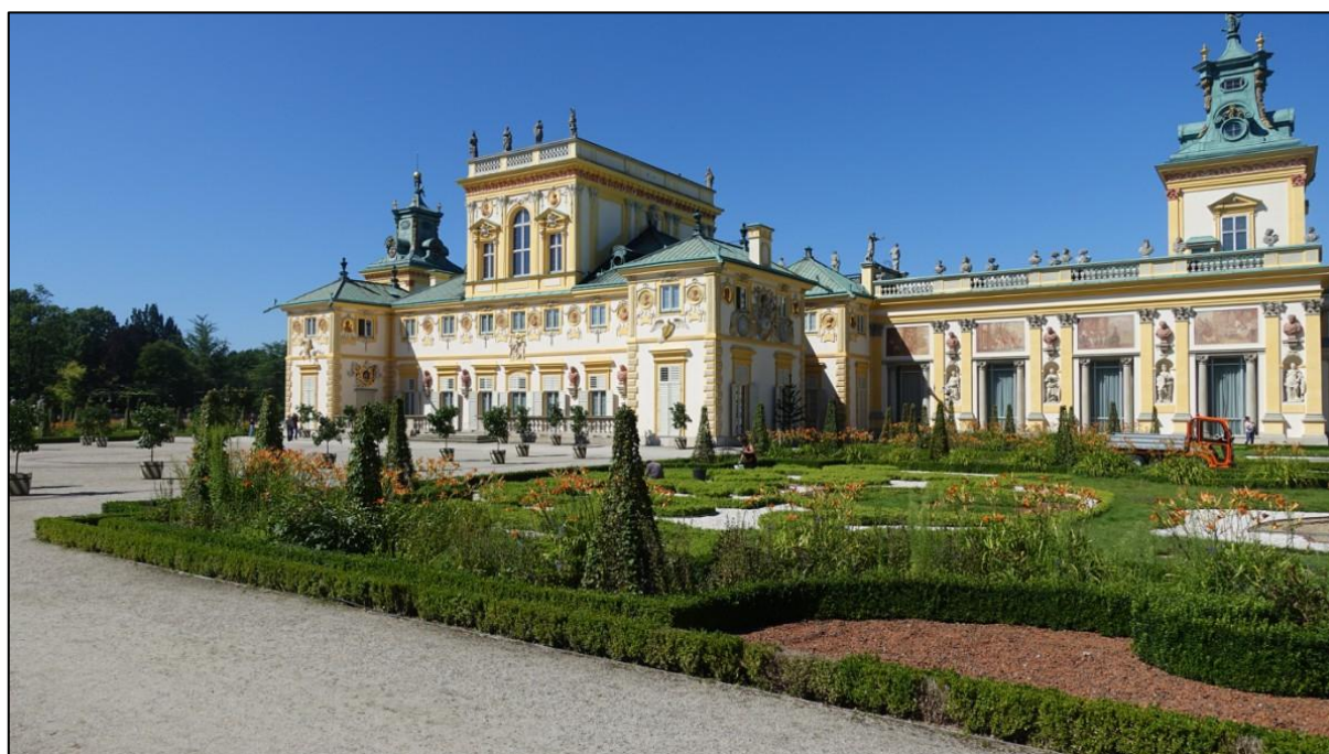
Ryc. 4. Pałac w Wilanowie, fragment elewacji ogrodowej Źródło: Fot. T. Jędrysiak 2018

Na tę samą fazę dojrzałego baroku doby Sobieskiego przypada budowa szeroko zakrojonego przedsięwzięcia budowlanego w Poznaniu. Powstało tu bowiem monumentalne Kolegium i kościół zakonu jezuitów (obecnie poznańska fara – Bazylika kolegiacka Matki Bożej Nieustającej Pomocy, św. Marii Magdaleny i św. Stanisława Biskupa w Poznaniu). Budowa trwała od połowy XVII wieku do 1701 roku, prowadzona przez cały szereg znaczących architektów w tym Tomasza Poncino czy Bartłomieja Nataniela Wąsowskiego – teoretyka architektury jezuickiej i jednocześnie rektora kolegium oraz Jana Catenazziego. Dekoracje sztukatorskie wnętrza wykonał Alberto Bianco, a malowidła Karol Dankwart. Ołtarz główny i portal wejściowy przypisywane są, słynnemu z wielu realizacji w Wielkopolsce, Pompeo