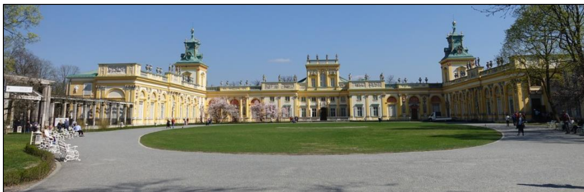
Ryc. 3. Pałac w Wilanowie Źródło: Fot. T. Jędrysiak 2018