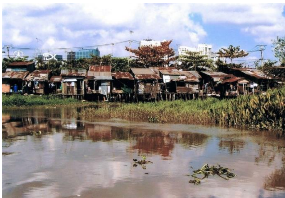
Ryc. 2. Dzielnice ubóstwa w Sajgonie, Wietnam