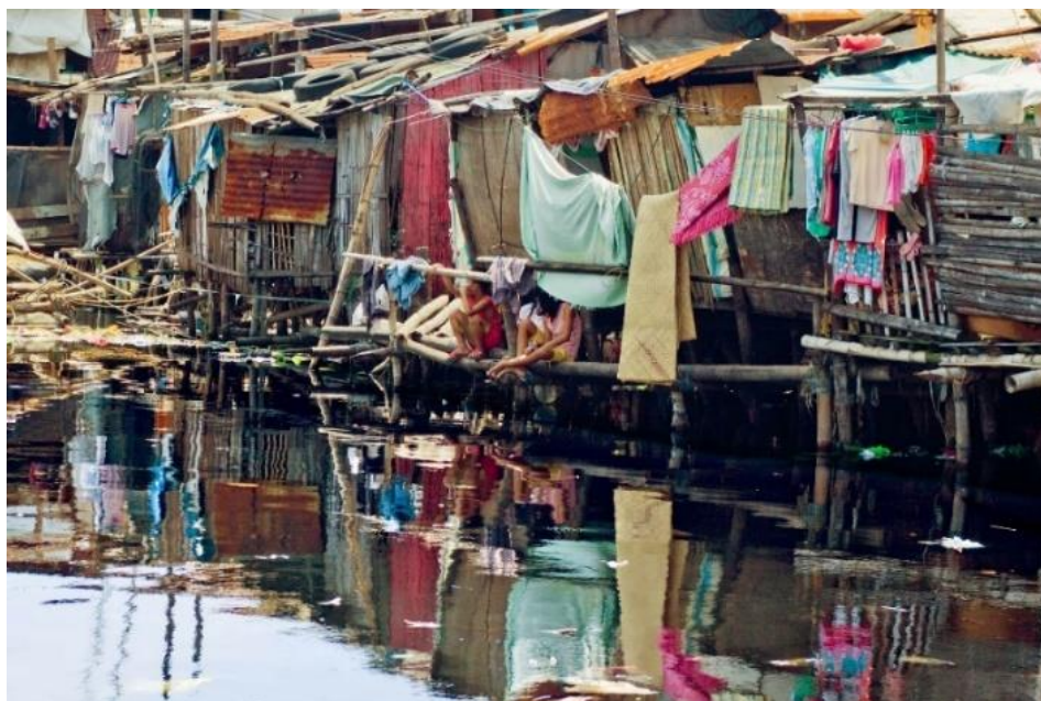
Ryc. 3. Dzielnice ubóstwa w Manili, Filipiny