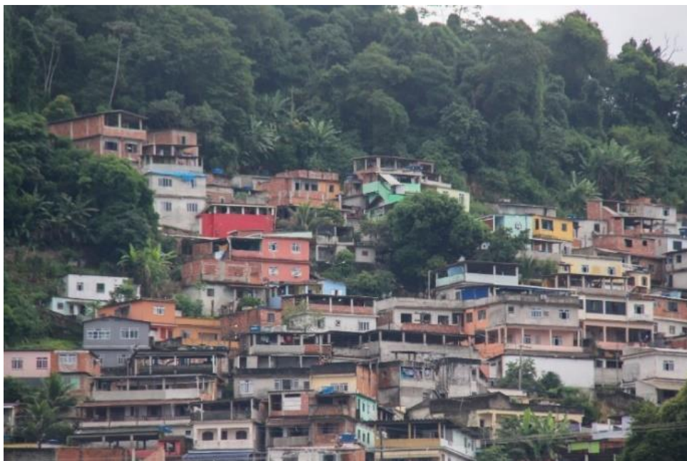
Ryc. 1. Dzielnice biedy w Rio de Janeiro, Brazylia

w Indiach (tab. 1) [Rolfes 2010 s. 62; Jones, Sanyal 2015, s. 3; Dyson 2012, s. 257; Slikker, Koens 2015, s. 76].