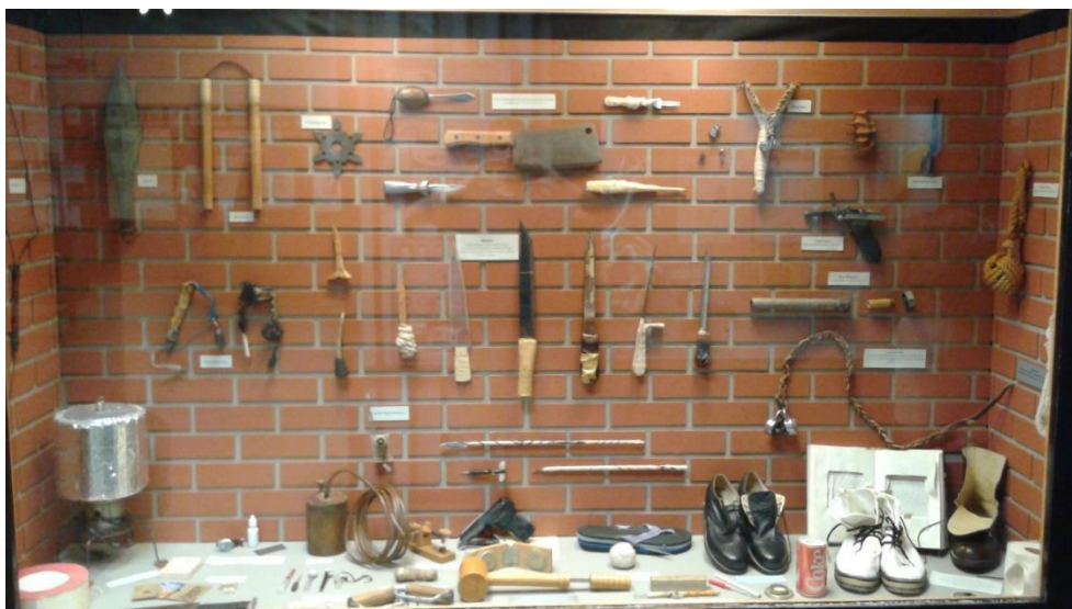
Ryc. 2. Wystawa przedmiotów przemyconych przez więźniów, Muzeum Więzienne w Teksasie, Huntsville, USA