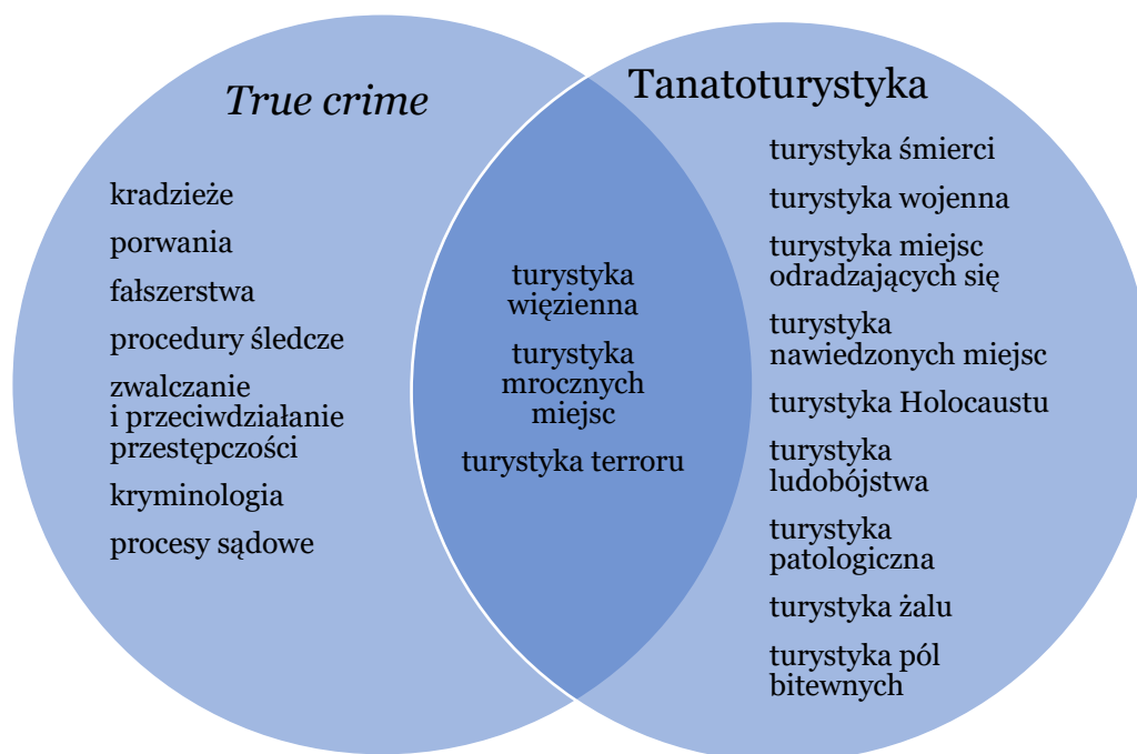
Ryc. 1. Zakres tematyczny turystyki true crime i tanatoturystyki