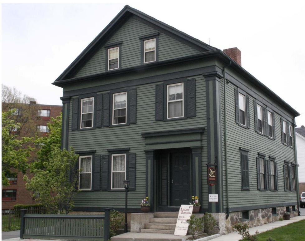
Ryc. 3. Lizzie Borden House, Fall River, USA

przekształcane w hotele. Przykładem jest dom Lizzie Borden w Fall River w stanie Massachusetts (ryc. 3). Jego właściciele – małżeństwo Andrew i Abby Bordenowie – zostali w nim zamordowani 4 sierpnia 1892 roku. Poszlaki w śledztwie wskazywały na młodszą córkę Andrew, Lizzie, jako morderczynię, jednak została ona uniewinniona wskutek braku wystarczających do skazania dowodów [Robertson, 2019]. Była to jedna z najgłośniejszych zbrodni w Stanach Zjednoczonych XIX wieku, a proces relacjonowały media z Bostonu i Nowego Jorku. Sprawa mocno zakorzeniła się w amerykańskiej popkulturze. Postać Lizzie Borden pojawia się w filmach i książkach. Jej dom jest obecnie hotelem, a jednocześnie muzeum, które prezentuje historię rodziny, morderstwa i dochodzenia. Istnieje możliwość zwiedzania domu i wynajęcia pokoju jednego z dawnych mieszkańców domu. Na śniadanie podawane są dania, które jadła rodzina Bordenów rankiem w dniu zabójstwa. Obiekt oferuje również „polowanie na duchy” oraz wycieczkę po mieście Fall River, podczas której zwiedza się rzekomo nawiedzone miejsca [lizzie-borden.com 14.12.2021].