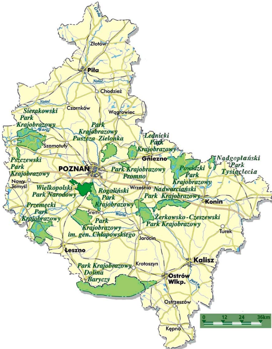
Ryc. 1. Lokalizacja wielkopolskich parków krajobrazowych

Cechą charakterystyczną omawianych obszarów jest znaczne zróżnicowanie pod względem struktury gruntów. W większości parków dominującą formą użytkowania powierzchni są użytki rolne, natomiast w trzech lasy (powyżej 50%), zaś udział wód waha się od 0,7% do prawie 14% [Uglis 2010b, s. 79].