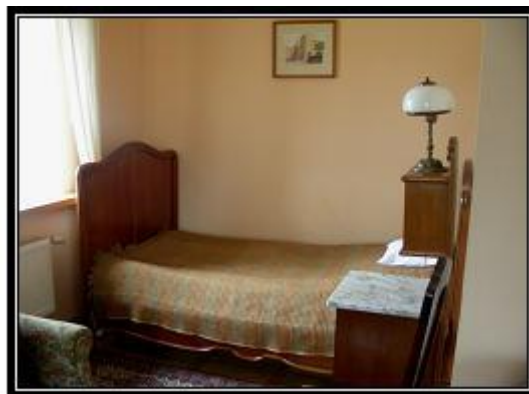
Ryc. 10. Pokój w dworku w Radziejowicach