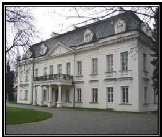
Ryc. 4. Pałac w Radziejowicach