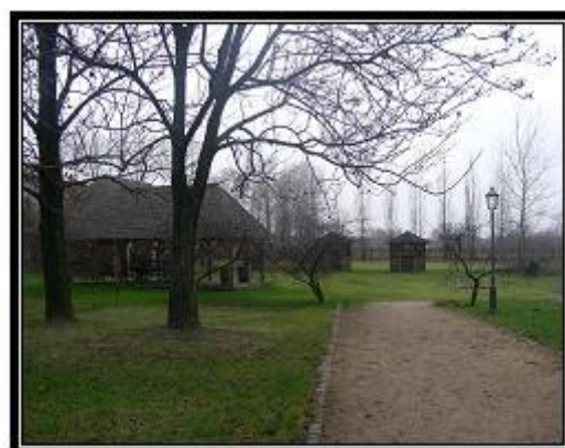
Ryc. 12. Teren piknikowy w DPT

Oprócz organizacji konferencji na terenie założenia pałacowo-parkowego przygotowuje się, zgodnie z życzeniami klientów, bankiety i pikniki (ryc. 11). Od kilku lat funkcjonuje także profesjonalnie przygotowany teren piknikowy (ryc. 12) zlokalizowany w pobliżu Dworku modrzewiowego. Na kompleks składają się: dwie wiaty, dwie drewniane altany i stanowisko grillowe. Atutem jest fakt, iż teren jest nagłośnieony i częściowo oświetlony. Daje to możliwość organizacji pikników i przyjęć w plenerze liczących od kilku do kilkuset uczestników, niezależnie od warunków pogodowych.