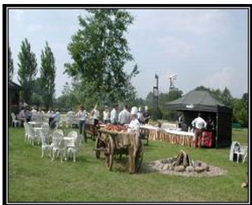
Ryc. 11. Bankiet w plenerze

W lutym 2007 roku oddano do dyspozycji gości DPT w Radziejowicach dwie sale w Nowym Domu Sztuki. Zajmują one powierzchnię 250 i 170 m 2 , co stwarza możliwość organizacji dużych konferencji, koncertów, recitali itp. Sale te rozdziela holl, a w budynku dodatkowo znajdują się również: zaplecze gastronomiczne, sala techniczna, garderoby i toalety.