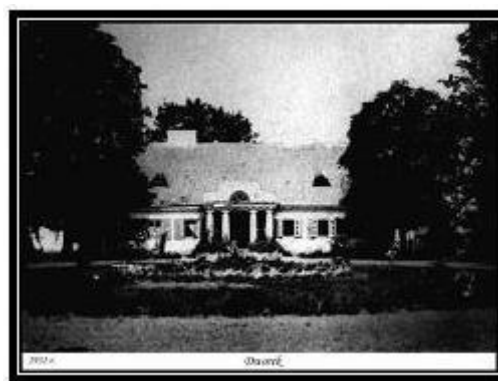
Ryc. 2. Dworek modrzewiowy w 1931 r.