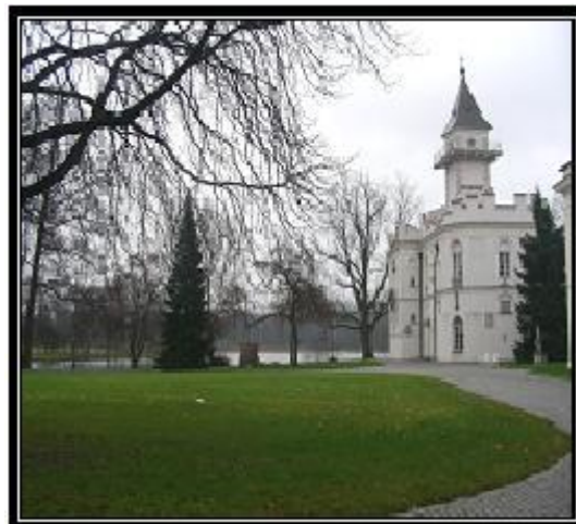
Ryc. 5. Zameczek w Radziejowicach Źródło: fot. Monika Paluch (2013)

W latach 1956-1964 poddasze pałacu przerobiono na pokoje dla gości DPT w Radziejowicach. Wewnątrz, na obu kondygnacjach, występuje amfiladowy układ pomieszczeń z reprezentacyjnymi salami ozdobionymi sztukateriami i polichromowanymi fryzami.