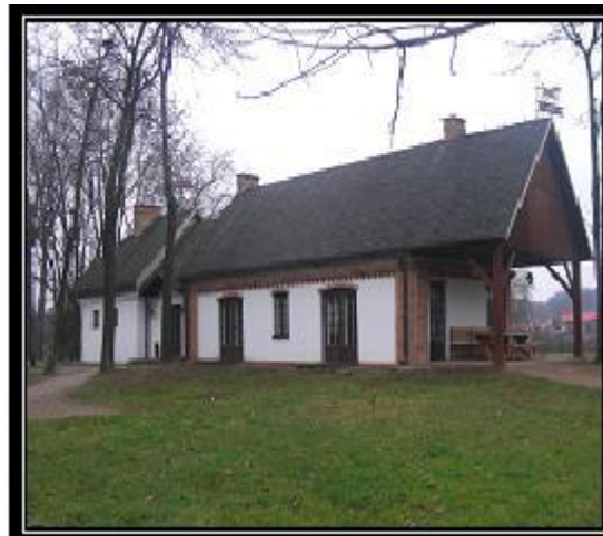
Ryc. 7. Stara Kuźnia w Radziejowicach

Zespołowi pałacowemu tradycyjnie towarzyszyły budowle o charakterze gospodarczym, niezbędne dla zapewnienia prawidłowego funkcjonowania tak dużego majątku jakim były Radziejowice. Do dziś niektóre z nich (np. gorzelnia, stajnie, wozownia) zachowały się w dość dobrym stanie. W ostatnich latach zrewitalizowano także tzw. czworaki przeznaczając je na nowoczesne pracownie artystyczne. W sąsiedztwie tych obiektów znajduje się zabytkowy młyn. Jego stan pozostawia wciąż jednak wiele do życzenia. Dotyczy to w szczególności jego fizjonomii, gdyż dawną drewnianą elewację przykrywa obecnie betonowa warstwa. Jest jednak nadzieja, że w najbliższym czasie zostanie przywrócony jego pierwotny wygląd.