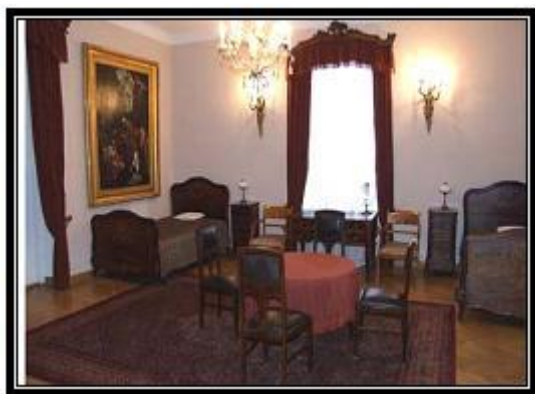
Ryc. 9. Apartament „D” w zamczku

Źródło: opracowanie własne na podstawie listy zakwaterowania z cennikiem DPT w Radziejowicach.