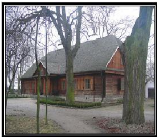
Ryc. 6. Dworek w Radziejowicach

Na terenie dawnego folwarku, w bezpośrednim sąsiedztwie terenu piknikowego oraz Kuźni i Dworku Modrzewiowego położony jest, oddany do użytku w lutym 2007 r., Nowy Dom Sztuki. „Jest to budowla parterowa, przykryta dwuspadowym dachem, rozległa jak wielka stodoła w zasobnym gospodarstwie. Północną i wschodnią ścianę tego budynku wypełniają przejrzyste szklane tafle. Wnętrze podzielone jest na trzy główne części: salę wielką, kameralny salonik i zaplecze. Budynek zaprojektował arch. Bartłomiej Martens” [Barbasiewicz 2007, s. 172].