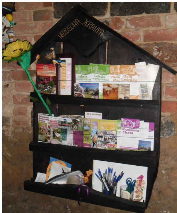
Fotografia 1. Materiały promocyjne w centrum informacyjno-dokumentacyjnym

działalności informacyjno-promocyjnej i wydawniczej. Liczne materiały dotyczące ekomuzeum można znaleźć także w siedzibie koordynatora programu ekomuzeum – Fundacji „Wrzosowa Kraina” w Chocianowie, w siedzibie Grupy Partnerskiej „Wrzosowa Kraina” w Przemkowie, oraz w siedzibie Fundacji Ekologicznej „Zielona Akcja” w Legnicy.