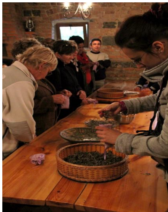
Fotografia 2. Zajęcia we „Wrzosowej Chacie” [„Wrzosowa Chata” w Borówkach 2010]

Ekomuzeum „Wrzosowa Kraina” tworzy sześć punktów: „Wrzosowa Chata”, „Pasięka Maja”, „Dom Leśnika”, „Piernikowy Świat Wandzi”, pracownia tkacka „Szara Przystań” oraz pracownia ceramiczna.