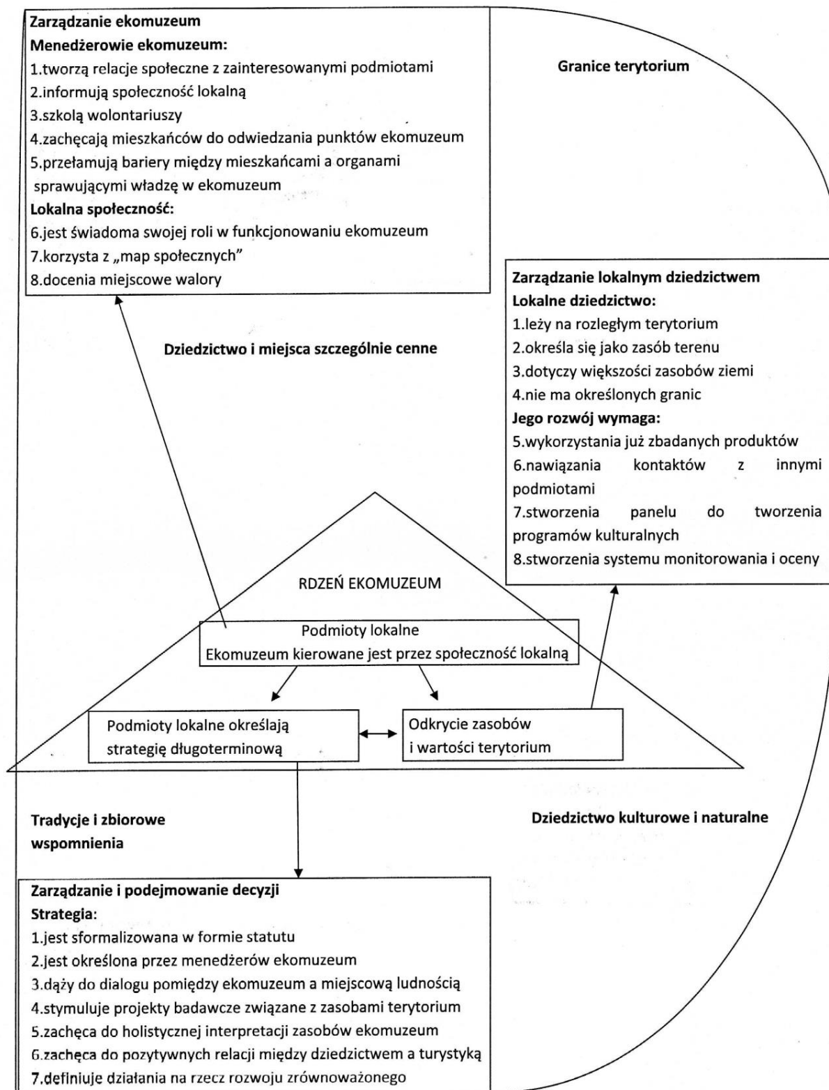
Rycina 1. Schematyczna wizualizacja kwestionariusza MACDAB (opracowanie własne wg Borrelli i in. 2008, s. 23).