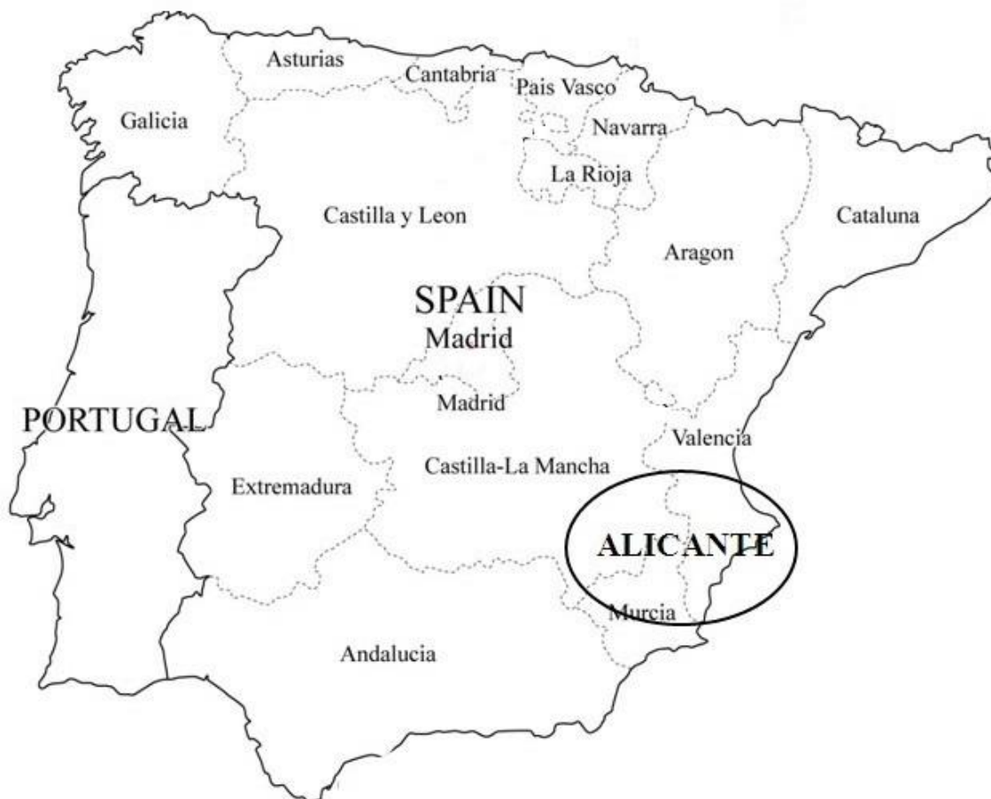
Ryc. 1. Położenie prowincji Alicante