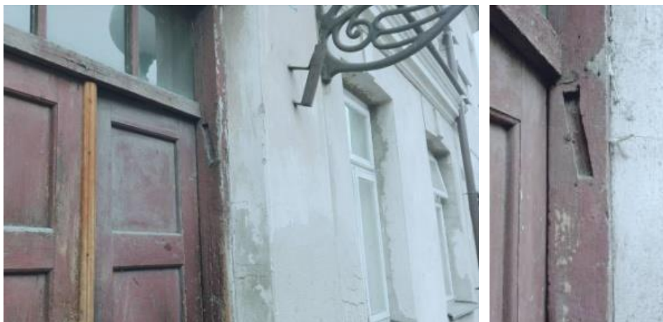
Ryc. 1. Ślad po mezuzie przy ulicy Moniuszki 14/16 w Białej Podlaskiej

Znając ten element biografii Pereca, turysta-czytelnik książek autora związanego z Warsztatem Literatury Potencjalnej zapewne sam podejmie wędrówkę, której symbolem może stać się lubelska latarnia, paląca się dzień i noc jako pomnik pamięci (post-pamięci, pamięci zbiorowej i kulturowej) o zgładzonych w Holokauście mieszkańcach miasta. Innym symbolem tego typu świadomego podróżowania mogą stać się wspomniane ślady po mezuzach (ryc. 1).