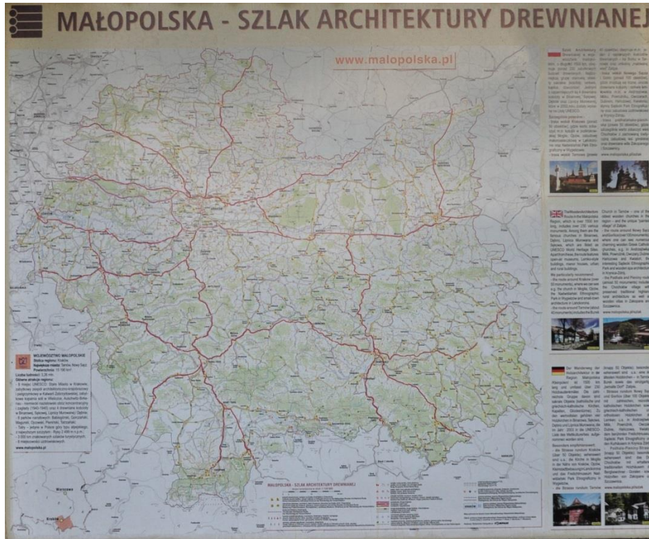
Ryc. 3. Tablica Małopolskiego Szlaku Architektury Drewnianej przy kościele w Sękowej