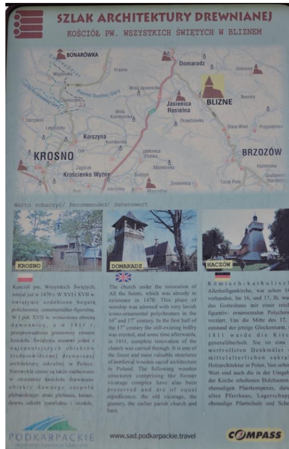
Ryc. 2. Tablica Szlaku Architektury Drewnianej przy kościele w Bliznem