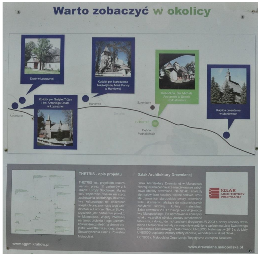
Ryc. 4. Tablica informacyjna przy kościele w Dębnie Podhalańskim