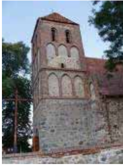
Foto 13. Wieża kościoła w Kruszynach, widok od pn., z podwórca plebanii.

Opuszczamy Kruszyny i udajemy się drogą lokalną na Książki, a następnie – po ok. 1 km – skręcamy w lewo na Brudzawy (łącznie ok. 3 km). We wsi kościół gotycki p.w. św. Andrzeja Apostoła. Orientowany, salowy, prostokątny z zakrystią, kruchtą i wieżą (Foto 14.). W dolnych partiach z kamienia, w górnych ceglany. Surową bryłę ożywia trójkątny szczyt wschodni dekorowany sześcioma sterczynami i trzema blendami umiejscowionymi w centralnych polach szczytu. Jego płynnym przedłużeniem jest szczyt zakrystii, dekorowany trzema niewielkimi fialami i blendą. Całość elewacji wschodniej tworzy w rezultacie harmonijną, choć surową całość (Foto 15.). Wieża kościoła, umiejscowiona w jego zachodniej części, reprezentuje typ dość często spotykany w Ziemi Chełmińskiej. Jest w dolnej partii czworoboczna, a nieco powyżej fryzu wieńczącego korpus płynie przechodzi w ośmiobok.