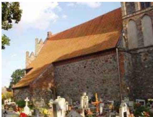
Foto 1. Pn. elewacja nawy kościoła w Dębowej Łące

Elementami, które pozwalały na wykazanie się architektom i muratorom inwencją były za to wieże i szczyty. Oglądając je – mówię tutaj o swoich odczuciach – trudno nie podziwiać