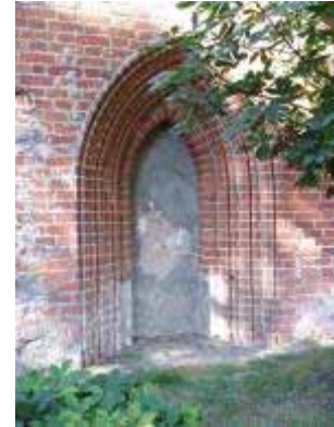
Foto 22. Zamurowany portal pd. fary w Kurkocinie.

Dominantę skromnego, ostatnio na nowo otynkowanego i pomalowanego na biało wnętrza stanowią barokowe ołtarze (KZSP, t. XI.19, s. 6 – 7. Zob. też TST).