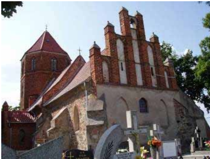
Foto 25. Widok kościoła w Niedźwiedziu od pd.-wsch.

Kościół w Niedźwiedziu jest jednym z ciekawych i wcale licznych przykładów łączenia przez mistrzów budowlanych kamienia, z którego wzniesiono jego dolne partie, oraz cegły służącej w znacznej mierze jako materiał do wykonania elementów dekoracyjnych (szczyt wschodni, portale) (Foto 25). Na uwagę zasługuje też dość typowa, lecz ciekawa, umiejscowiona od zachodu wieża, o dolnej kondygnacji kwadratowej, a górnej ośmiobocznej (Foto 26).