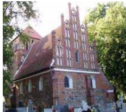
Foto 18. Widok fary w Łobdowie od pd.-wsch..

Co się tyczy monumentalnej, wzniesionej na planie zbliżonym do kwadratu wieży, mamy do czynienia z obiektem niewątpliwie przebudowywanym, zapewne z powodu katastrofy budowlanej, dlatego nietypowym. Od pn-wsch wieżę wzmacnia wydatna, pięciuskokowa przypora. Całość uzupełniają nieregularnie rozmieszczone