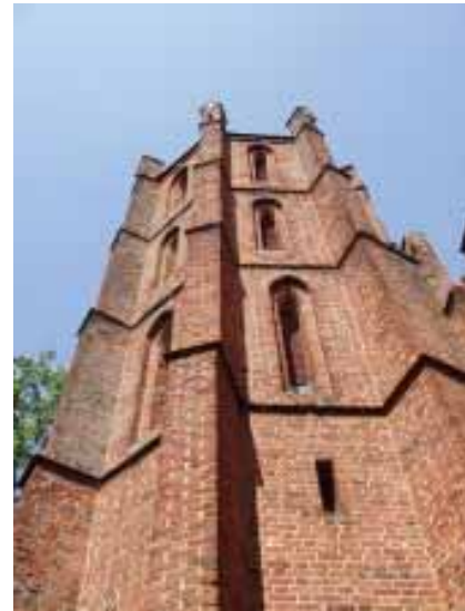
Foto 2. Wieża kościoła w Lembargu, ujęcie od pd.

Oczywiście na przestrzeni wieków wiele z wymienionych kościołów poddawanych było różnorodnym przebudowom. Zasadniczo jednak nie zniekształciły one brył i ogólnego architektonicznego charakteru, choć za to niejednokrotnie pozbawiły obiekty oryginalnego detalu architektonicznego 15 . Często zaś w sposób mniej lub bardziej interesujący wzbogaciły je, stając się cennym świadectwem stosunku do materii zabytkowej w przeszłości. Oczywiście estetyczne walory wspomnianych przekształceń mogą być przedmiotem dyskusji. Zapewne puryści z chęcią usunęliby nawarstwienia, starając się przywrócić „oryginalny”, XIII- czy XIV-wieczny kształt obiektów, tak jak to można w sposób aż nadto dobitny zobaczyć w realizacjach konserwatorskich, którym poddano ostatnio szereg barokowych ołtarzy z kościołów toruńskich (czy też u św. Anny w Radzynie Chełmińskim). Osobiście, mając w pamięci słowa Michela Pastoureau 16 , uważam te wszystkie architektoniczne dodatki za element dodający poszczególnym obiektom uroku i świadczący o ich bogatych, niejednokrotnie tragicznych dziejach. Również z tego względu gotyckie kościoły Ziemi