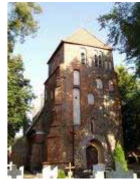
Foto 19. Wieża łobdowskiego kościoła.

otwory okienne i blendy, oraz niski czterospadowy, kryty dachówką dach. (Foto 19)