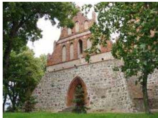
Foto 3. Zachodnia elewacja kościoła w Wabczu.