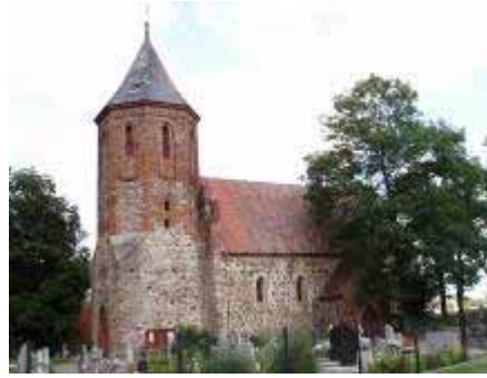
Foto 14. Ogólny widok kościoła w Brudzawach od pd.-zach.