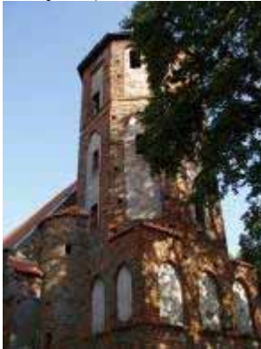
Foto 20. Widok zach., wieżowej partii kościoła w Kurkocinie od pn.

uwagę zwraca umieszczona od zachodu wieża, w dolnej partii kwadratowa, w górnej ośmioboczna. W porównaniu z innymi tego typu wieżami jest ona wysmukła i posiada ciekawą dekorację, na którą składają się z reguły ostrołukowe blendy (za wyjątkiem najwyższej kondygnacji), fryz opaskowy oddzielający najwyższą kondygnację wieży oraz nierównomiernie rozmieszczone otwory okienne. W północno-zachodnim narożniku wieży znajduje się wtopiona w elewację cylindryczna wieżyczka schodowa przykryta stożkowym daszkiem, (Foto 20 – 21) zaś w południowej elewacji korpusu efektowny uskokowy, wykonany z profilowanej cegły, zamurowany portal ostrołukowy (Foto 22.). W ogóle w kościele tym zachował się cały zespół ostrołukowych portali (pod wieżą, w północnym odcinku ściany zachodniej, czyli w wejściu na chór i wieżę, uskokowy, otynkowany do zakrystii).