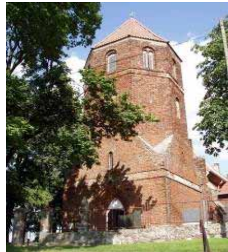
Foto 26. Wieża kościoła w Niedźwiedziu.

Ciekawe wyposażenie, głównie barokowe, jednak z elementami gotyckimi.