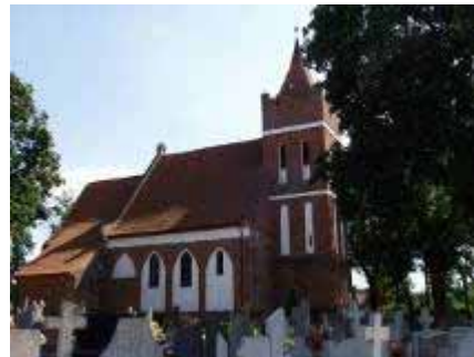
Foto 10. Ogólny widok kościoła w Bobrowie od pn.

Najciekawszym elementem wyposażenia, zasadniczo późnobarokowego i rokokowego, jest znajdujący się w ołtarzu głównym obraz „Matka Boska z Dzieciątkiem i św. Janem