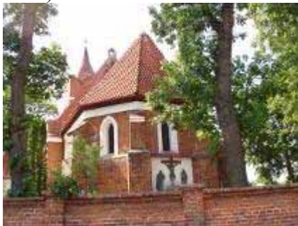
Foto 9. Widok trójdzielnie zamkniętego prezbiterium kościoła w Bobrowie od wsch.

Sama świątynia, orientowana, zbudowana z cegły na podmurówce z głazów narzutowych, należy do najstarszych w Ziemi Chełmińskiej. Jej zamknięte – co jest rozwiązaniem relatywnie rzadkim – trójbocznie 24 , oszkarpowane prezbiterium oraz częściowo nawę wzniesiono ok. 1260 r. Rozbudowana w 1 poł. XIV w., w 1 poł. XVII w. uzyskała w 1 poł. XVII w. murowaną wieżę. Południowa ściana prezbiterium posiada ciekawą dekorację składającą się z ostrołukowego okna z podwójnym uskokiem flankowanego blendami, zamkniętymi półkolistymi, spłaszczonymi łukami. Wieża jest interesującym przykładem stosowania przetworzonych form nawiązujących do gotyku w XVII w. Zwieńczona attyką i ceglana iglicą, jest podzielona fryzem opaskowym na kondygnacje dekorowane blendami. (Foto 9 – 10)