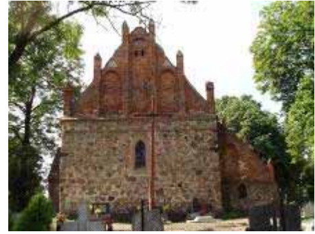
Foto 15. Harmonijna elewacja wsch. kościoła w Brudzawach.

Wyposażenie świątyni, głównie XVIII i XIX w., nie jest szczególnie godne uwagi (KZSP, t. XI.2, s. 24 – 25. Zob. też TST).