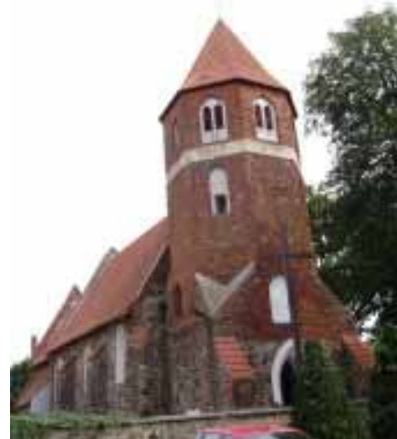
Foto 7. Widok ogólny kościoła w Nowej Wsi Królewskiej od pd.-zach.

Obejrzawszy kościół płużnicki, wyruszamy drogą wojewódzką nr 548 do Lisewa (ok. 6 km). W centrum tej dużej, wzmiankowanej od 1288 r. wsi, patrząc w kierunku jazdy po prawej stronie, na niewielkim, otoczonym murem i zajęтым przez cmentarz wyniesieniu, gotycki, orientowany kościół p.w. Podwyższenia Krzyża Św. i NMP Śnieżnej wzniesiony zapewne w 4 ćw. XIII w. Znacznie przebudowany z fundacji Stanisława i Jana Kostków przez muratora Jana Busadzii (?) w l. ok. 1551 – 1585. Wówczas to m.in. dobudowano masywną, efektownie dekorowaną blendami, opaskowymi fryzami i półszczytami część zach. korpusu wraz z wieżą (Foto 8.). Obiekt następnie wielokrotnie odnawiano. Dziś prezentuje się nam salowa budowla z wyodrębnionym prezbiterium. Wzniesiona z kamienia polnego, łamanego granitu i cegły. Ciekawie ukształtowany szczyt prezbiterium, schodkowy, dekorowany