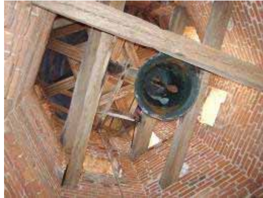
Foto 21. Wnętrze górnej kondygnacji, pełniącej funkcję dzwonnicy wieży kościoła w Kurkocinie.