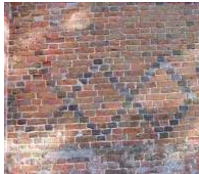
Foto 5. Rombowa, wykonana z zendrówki dekoracja pd. ściany nawy kościoła w Okoninie.