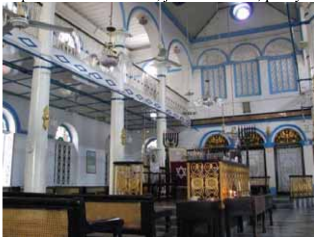
Foto 3. Synagoga w Yangoonie

na szczycie jednej z gór, niedaleko Pago/Bago czy jak kto woli Pegu. Tam też można spotkać tłumy wiernych, szczególnie pomiędzy listopadem a marcem, gdy przypada szczyt sezonu pielgrzymkowego. Na chwiejącej się lekko skalnej bryle została postawiona 7,5 metrowa stupa. Zarówno monolit, jak i ona sama, pokryte są złotą powłoką.