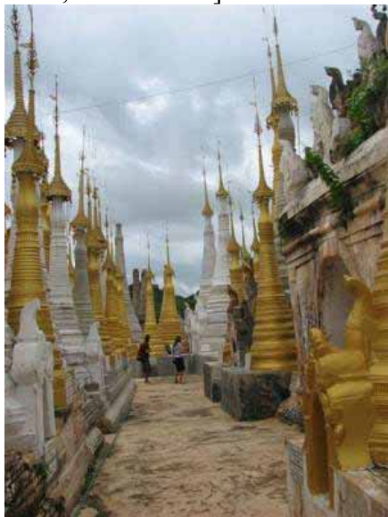
Foto 2. Na dziedzińcu Shwe Dagon