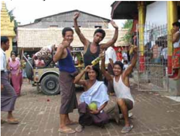
Foto 6. Gejowscy, tutaj lekko podchmieleni, uczestnicy festiwalu nat's

niejednokrotnie, jeśli nie przeważnie, o homoseksualnych skłonnościach. Według popularnych wierzeń osoby o rozchwianej tożsamości są lepszym, bo wrażliwszym materiałem na medium, pośrednika między bóstwem, światem duchów i ludzi. Wśród uczestników festynu-festiwalu nie brakuje więc i społeczności gejowskiej, choć nie da się z pewnością powiedzieć, że ta akurat grupa nadawałaby ton imprezom, choć głosów takich też nie brakuje [ Myanmar Times... ; Moe 2009; Nikom]. Niewątpliwie kontrowersyjna to sprawa, ale cokolwiek by powiedzieć, festiwale nat's są atrakcją i oryginalnym, zapewne ciągle autentycznym ludowym misterium. Czasem nawet da się wypatrzyć swoiste rarytasy – egzorcyzmy na samotnych, niezmeżnych kobietach, w celu wypędzenia z nich złego ducha. Niewątpliwie więcej jednak spotkamy tam autentycznej ludowej zabawy, zakrapianej lokalnym alkoholem. Trudno się dziwić, że religijne autorytety kraju, raczej dystansują się od tych imprez, ponieważ nie da się ich tak łatwo zakwalifikować {Reed, Grosber 2005, s. 59-61, Nikom}.