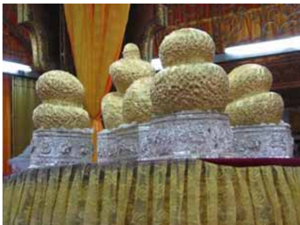
Foto 9. Wizerunki Buddy i jego uczniów w klasztorze Phaung Daw Oo Paya nad Jeziorem Inle

Nasze podróże co podkreśliła Joanna Ząbkowska-Para, mogą posiadać „charakter autoteliczny i instrumentalny”. Drugi typ o hedonistycznym lekko nastawieniu, nie będzie nas tutaj interesował. Ten właściwy, czyli pierwszy według autorki też, zakłada podróż w głąb siebie; to „peregrynacja duchowa [...] do osiągnięcia celu – wyciszenia, wypoczynku, oderwania od codzienności, relaksacji i homeostazy”. To podróż mistyczna [Ząbkowska-Para 2008, s. 291-295], a takową jest w stanie zagwarantować w dużej mierze, wyprawa do Birmy – Myanmaru. Kraj ten z całą pewnością powinien być doceniony i brany pod uwagę w wyborze potencjalnych tras podróży przez turystę kulturowego.