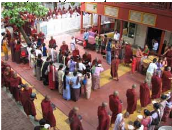
Foto 5. Mnisi w kolejce po posiłek

szansa obserwacji na żywo ceremonii obdarowania mnichów przez miejscową społeczność jedzeniem, z zawczasu przygotowanych kadzi z ryżem, warzywami i bananami wyjmowanymi z koszy. Nikt nie stawia też przeszkód w towarzyszeniu zakonnikom podczas ablucji, czy już samego posiłku. Według tradycji, zasadniczy posiłek mnicha powinien zostać spożyty przed 12 w południe, ponieważ później ich obowiązkiem jest oddawać się medytacjom i nic nie może im w tym przeszkadzać. W Mingun można zobaczyć największy z istniejących dzwonów (moskiewski Kołokoł jest pęknięty!). Sagaing to jeszcze jedno śliczne, święte miasto z 500 stupami świątyniami. W Paleik godna zobaczenia jest świątynia z czczonymi tam pytonami, a pora ich karmienia – koło południa, sama w sunie jest atrakcją.