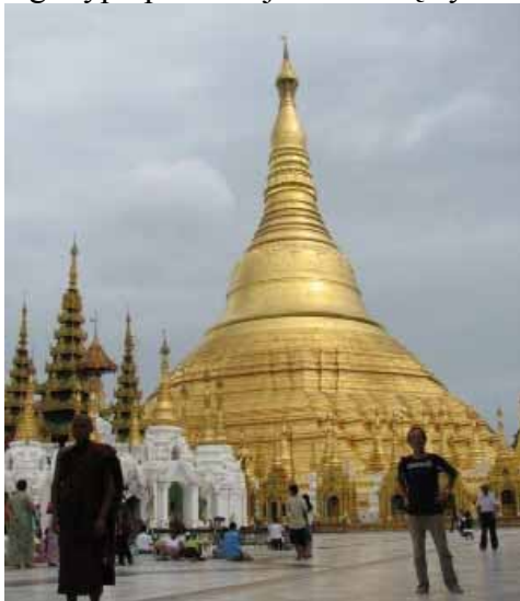
Foto 1. Shwe Dagon Pagoda w Yangoonie

utonięcia, opowiadająca o losach grupy amerykańskich turystów. Fabuła wpleciona we fragmenty lokalnej rzeczywistości momentami miesza się z poetyką realizmu magicznego 13 . Na polskim rynku księgarskim egzystują również dwa zbiorowe, przetłumaczone przewodniki pod wspólnym tytułem Azja Południowo-Wschodnia . Pierwszy nich wydała znana oficyna Pascal , a drugą sławny w globalnej skali National Geographic . W tego typu zbiorczych publikacjach tylko część poświęcona została Myanamarowi. Ich podstawową zaletą są informacje praktyczne, ponieważ partie poświęcone historii, społeczeństwu, czy sztuce w tego typu publikacjach muszą być i są powierzchowne 14 .