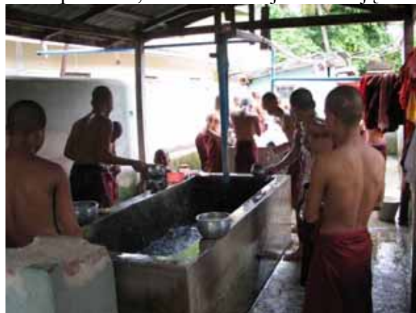
Foto 6. Mnisi podczas ablucji