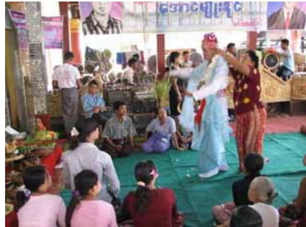
Foto 7. Nat's festiwal w Amarapura; jeden z nat tanecznym transie

Także inne warte zobaczenia, ważne eventy o religijnym charakterze, posiadają zazwyczaj swój animistyczny rodowód, zostając z czasem zaakceptowane przez zwycięski buddyzm. Dowodzą tego Thadingyut, czyli święto świateł obchodzone na przełomie września i października, jak również pełen pogody i humoru tzw. Water Festiwal (Thingyan) połączony z celebrowaniem według własnej wersji kalendarza, birmańskiego Nowego Roku. Ten drugi odbywa w połowie kwietnia i przypomina momentami nasz rodzimy śmigus-dyngus. Typowo buddyjskim świętem będą za to urodziny Buddy na przełomie kwietnia i maja [Hall 1998, s. 13-14; Reed, Grosber 2005, s. 28, 340-341].