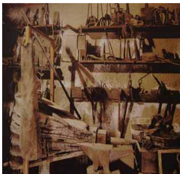
Zdj.7 Warsztat kowalski