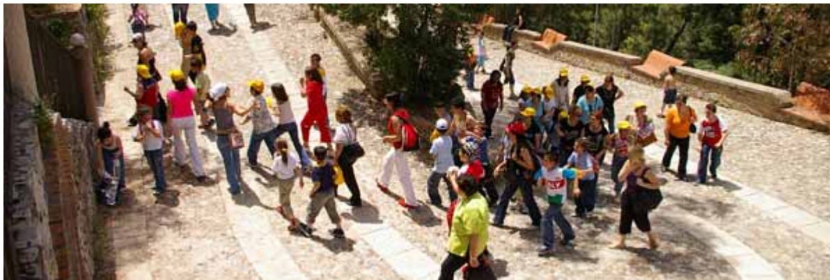
Zdj.13 Zwiedzające park dzieci

aktywny charakter parku jest jednym z najistotniejszych czynników jego rozwoju, dzięki któremu Jalari skutecznie broni się przed stereotypowym postrzeganiem muzeów jako wymarłej rupieciarni.