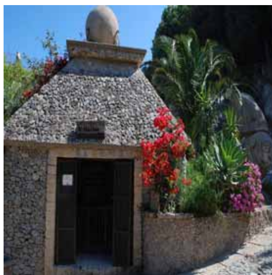
Zdj.5 Jeden z warsztatów rzemieślniczych (zdj. własne)