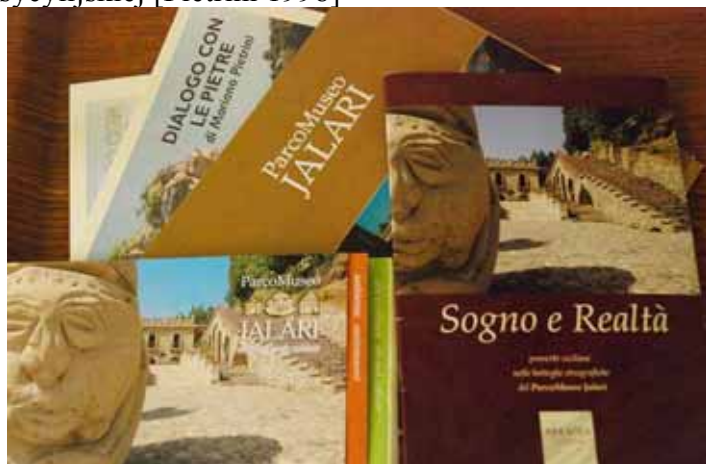
Zdj.3 Niektóre publikacje Jalari

publikacji jest wysoka temperatura emocjonalna, wynikająca z głębokiego przywiązania do tradycji ziemi ojczystej oraz świadomości zagrożeń kultury ojców. Lokalny patriotyzm, zamiłowanie do sztuki i kultury tradycyjnej były też głównymi motorami budowy parku. Droga od idei do realizacji obrazuje również silną pozycję i wartość przypisywaną rodzinie sycylijskiej [Pietrini 1998]