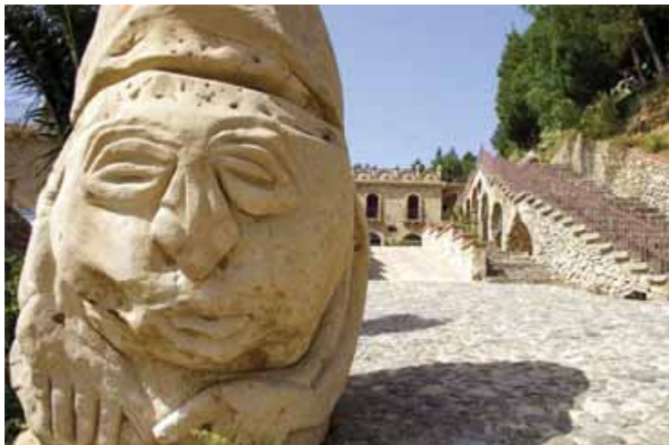
Zdj. 2 Widok ogólny – Jalari

Dość synkretyczna idea założycieli parku, uwidaczniająca się w jego hybrydycznym charakterze, przynosi także różnorodne jego obrazy we włoskiej jak i zagranicznej prasie i publikacjach dotyczących ruchu turystycznego z lat 1995 - 2010. I tak np. w przewodniku po Włoszech Viviparchi z 2010, który wzmiankuje tylko 4 parki