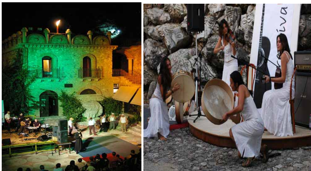
Zdj. 14,15 Espressivamente

Espressivamente jest, organizowanym rokrocznie od 2004 roku, festiwalem artystycznym na wolnym powietrzu, będącym kompilacją elementów sztuki ulicy i muzycznych. W tym czasie Jalari gości muzyków folkowych, trupy parateatralne i cyrkowe jak i niezależnych artystów z całych Włoch i z zagranicy. Idea przyświecająca organizatorom to wymiana treści kulturowych pomiędzy uczestnikami poprzez muzykę, taniec i śpiew a także promocja regionu i parku.