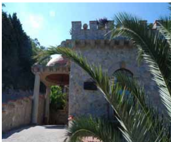
Zdj.10 Il centro congressi

Ideologicznym punktem wyjścia dla rozwiązań architektonicznych z kolei była twórcza kompilacja różnorodnych stylów, które dominowały na wyspie podczas poszczególnych podbojów, najazdów i przewrotów. I tak wpływy greckie wyznacza linia kolumn, sklepienia budynków naśladują arabskie kopuły. Widoczne są także inspiracje dworską zabudową Burbońską a także Normañskimi zamkami. Ponadto do budowy wykorzystane zostały naturalne surowce wtórne, takie jak kamień, glina czy drewno oraz przedmioty mające bogate konotacje kulturowe jak np. koło młyńskie, które jeszcze kilkadziesiąt lat temu było elementem pejzażu dziś już niemożliwym do zobaczenia.