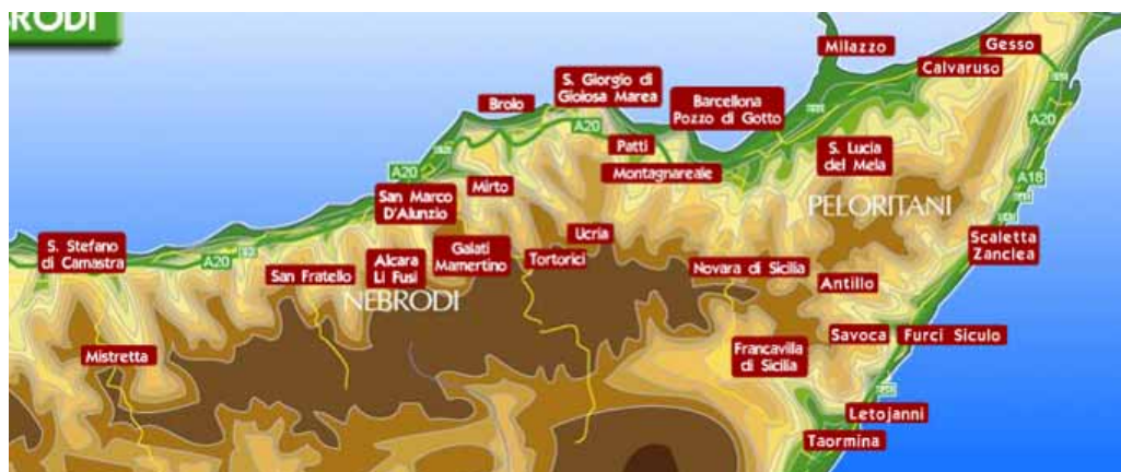
Zdj. 1 Muzea etnoantropologiczne w prowincji Mesyna w tym Parco Museo Jalari w Barcellonie Pozzo di Gotto.