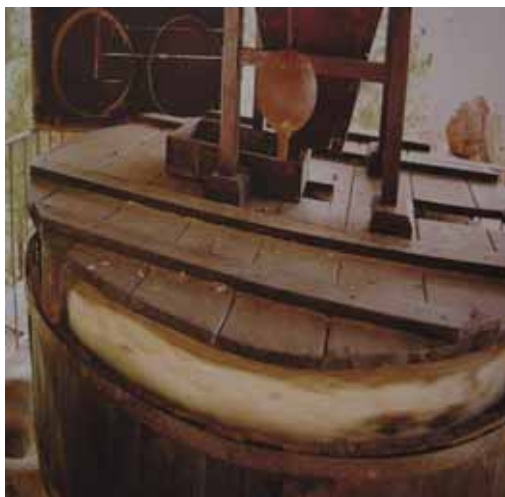
Zdj.8 Działający młyn wodny