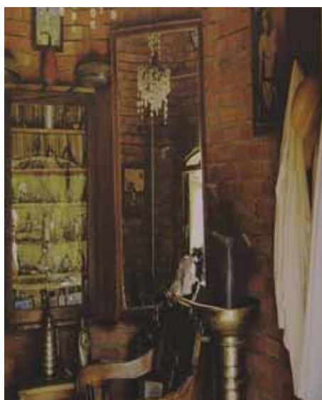
Zdj.6 Gabinet fryzjerski