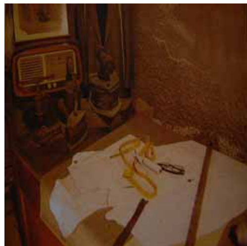
Zdj.9 Warsztat krawiecki

Ideologicznym punktem wyjścia dla rozwiązań architektonicznych z kolei była twórcza kompilacja różnorodnych stylów, które dominowały na wyspie podczas poszczególnych podbojów, najazdów i przewrotów. I tak wpływy greckie wyznacza linia kolumn, sklepienia budynków naśladują arabskie kopuły. Widoczne są także inspiracje dworską zabudową Burbońską a także Normañskimi zamkami. Ponadto do budowy wykorzystane zostały naturalne surowce wtórne, takie jak kamień, glina czy drewno oraz przedmioty mające bogate konotacje kulturowe jak np. koło młyńskie, które jeszcze kilkadziesiąt lat temu było elementem pejzażu dziś już niemożliwym do zobaczenia.