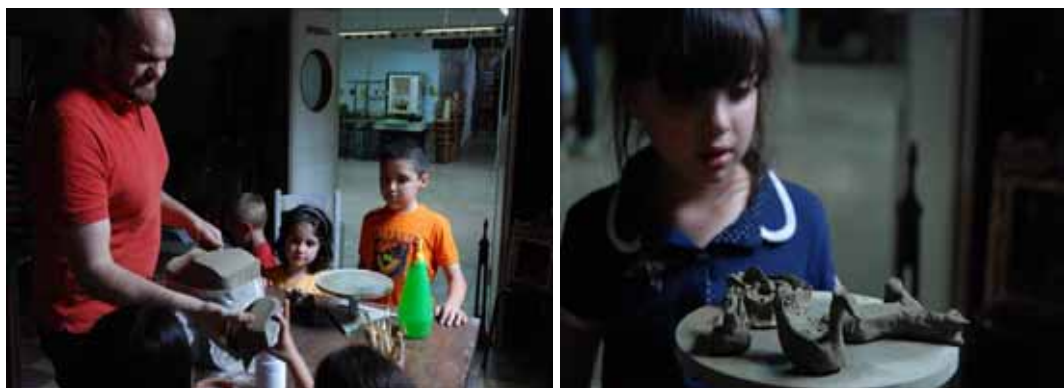
Zdj.12, 13 Kurs lepienia z gliny dla dzieci (zdjęcia własne 06.2010)

Działalność edukacyjna parku realizuje się również wielopłaszczyznowo. Poza zwykłym zwiedzaniem oferuje także szereg różnorodnych bloków edukacyjnych dla dzieci i młodzieży, szczególnie w ciągu roku szkolnego, przybierających formę lekcji muzealnych bądź warsztatów z dziedziny rękodzieła ludowego (np. warsztaty ceramiczne, plecionkarskie, kulinarne), muzyki i sztuki sycylijskiej. Wycieczki szkolne młodzieży włoskiej pochodzą z większości regionów Sycylii a także z Kalabrii z północnych Włoch. Nawet jeśli park jest zamknięty dla zwiedzających, grupy szkolne mogą go odwiedzić rezerwując wcześniej termin. Jalari stanowi także zaplecze wizyt studyjnych, będących elementem programów przewidzianych dla przedstawicieli branży turystycznej czy innych branż biznesowych. Predestynuje go do tego, także solidna baza noclegowa, konferencyjna oraz kulinarna. Przewodnicy po parku mówią ponadto w kilku językach europejskich, co pogłębia otwarcie na turystę z zagranicy. Z dokumentacji prowadzonej przez sekretariat wynika znaczny wzrost w ostatnich latach liczby odwiedzających z zagranicy, z europejskich krajów takich jak Niemcy, Francja, Hiszpania, Kraje Beneluksu oraz Polska, czy Azjatyckich reprezentowanych głównie przez Japonię.