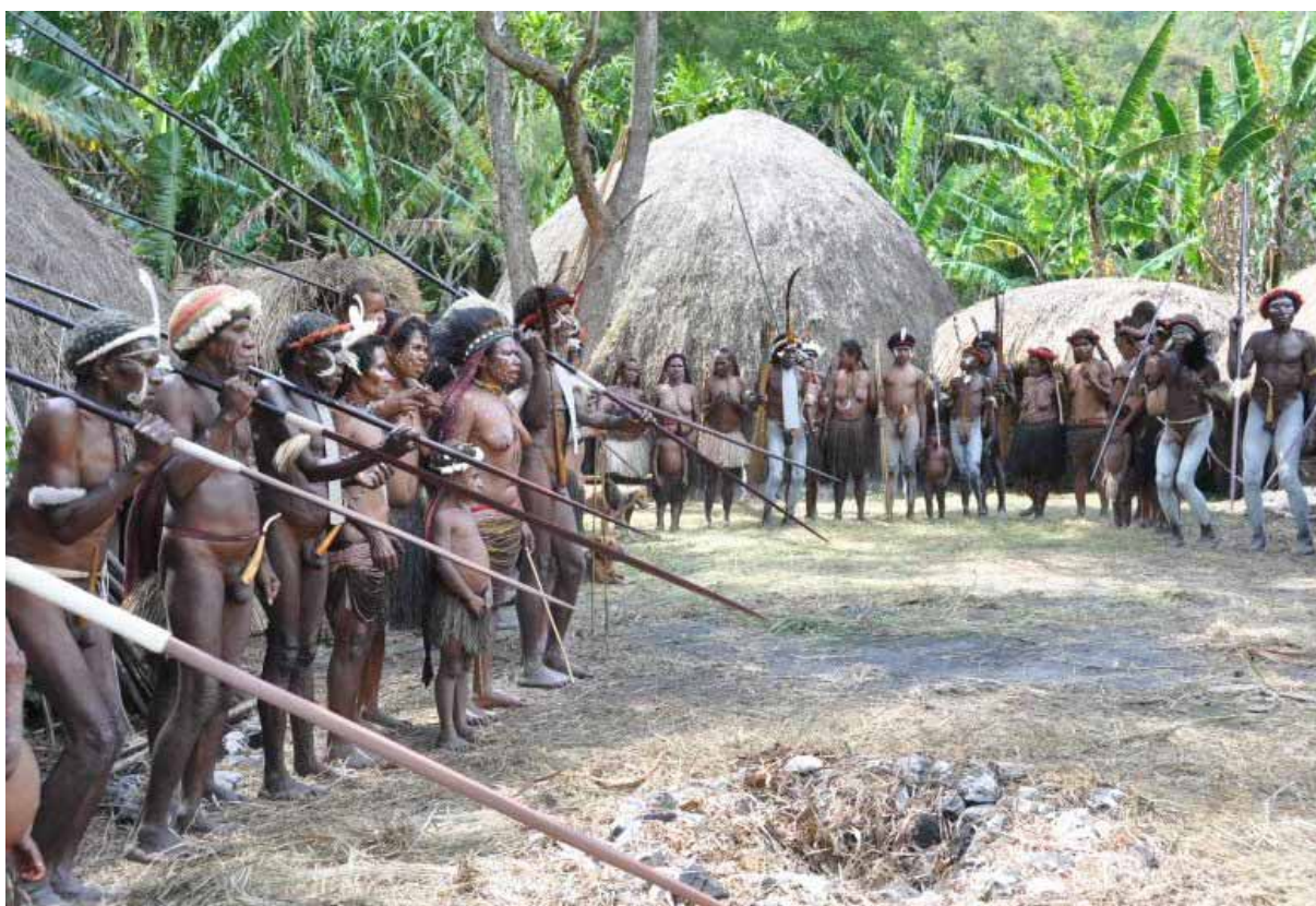
Foto 2. Inscenizacja ucztu u Papuasów na Nowej Gwinei

Stopniowo wpływy cywilizacji miejskiej odcinają jednak plemiona z Baliem od ich tradycji i wierzeń. Pojawili się jednak organizatorzy turystyki, którzy utwierdzili Papuasów w przekonaniu, że ich stroje, wierzenia, zwyczaje stały się towarem. Kwitnie handel pamiątkami (coraz bardziej natrętny), nadzy Papuasi czatują pod hotelem na turystów z swoimi rękodzielami. Na zamówienie biura podróży inscenizuje się bitwę między rodami zakończoną zgodą, tańcami i wspólną z turystami ucztą. Wszystko to jest ładnie wyreżyserowane, ale coraz mniej autentyczne. Wytrawni podróżnicy komentują, że to już „cepelia”.