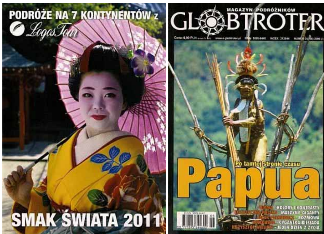
Okładki katalogu ofertowego LogosTour i magazynu podróżników „Globtrotter”

Kto jest uczestnikiem egzotycznych wypraw? Są to osoby płci obojga, chociaż częściej kobiety, w wieku najczęściej dojrzałym. W wyjazdach organizowanych przez MK Tramping z Krakowa zanotowano 65 % uczestników w wieku 27-56 lat, z czego 42 % między 27 a 46 rokiem, 18% to osoby starsze - w wieku 47-56 lat, 60 % kobiet i 40 % mężczyzn. Udział studentów i młodzieży w takich wyjazdach jest sporadyczny (ze względów finansowych). Wśród zawodów, jakie najczęściej są deklaruwane przez podróżników wymienić należy lekarzy, naukowców, prawników, biznesmenów wszelkiego rodzaju. Na wyprawie do Nowej Zelandii i Australii z LogosTourem w 2008 r. dominowali nauczyciele akademicki, lekarze, był właściciel szkoły ogrodniczej, budowlaniec dysponujący maszynami budowlanymi, 1 student i emerytowany pracownik naukowy. Podobnie jest na innych tego rodzaju wyjazdach.