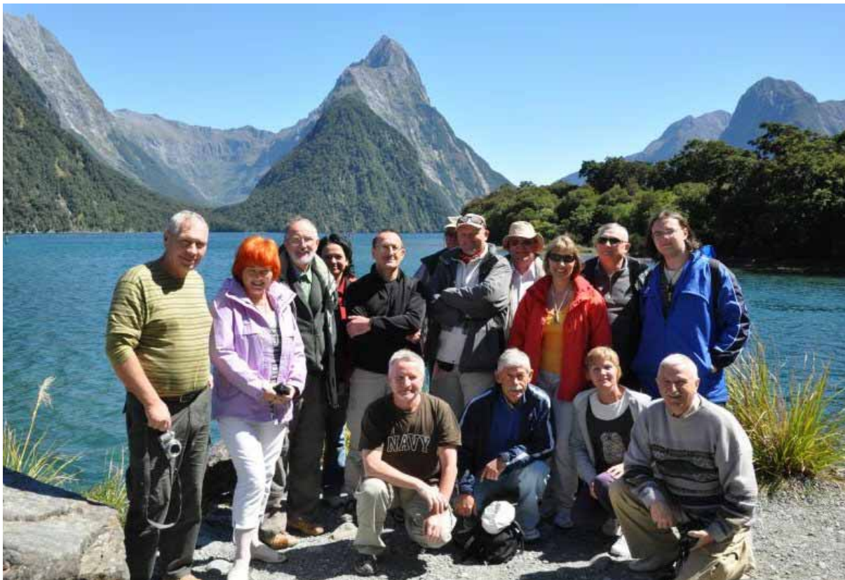
Foto 1. Uczestnicy wyjazdu LogosTour w Nowej Zelandii w Milford Sound