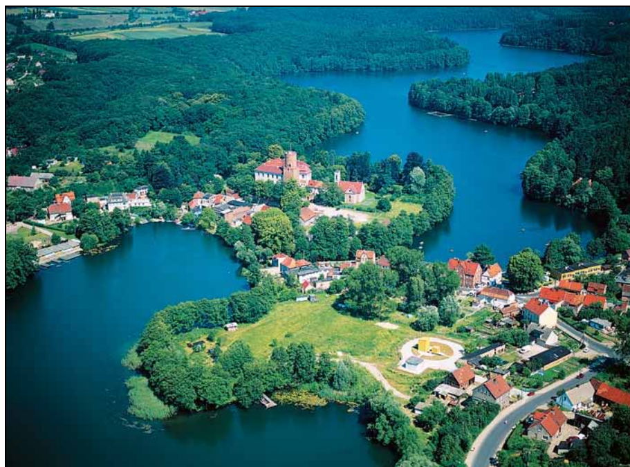
Fot. 1. Łągów Lubuski, widok z lotu ptaka

Łągów Lubuski – malowniczo opisany przez Michała Szczanieckiego i Gwidona Chmarzyńskiego „Zamek w Łagowie”, wydana w 1948 roku: „osada na wąskim przesmyku między dwoma jeziorami, garść domów przytulonych do wysokiego zamczyska, którego baszta wznosi się ku niebu, ślady dawnych fortyfikacji, dwie bramy z obu stron przesmyku, jedna „polska”, druga „marchijska”, wskazuje na pograniczne położenie tego grodu” [Szczaniecki, Chmarzyński 1948, s. 4 n.]