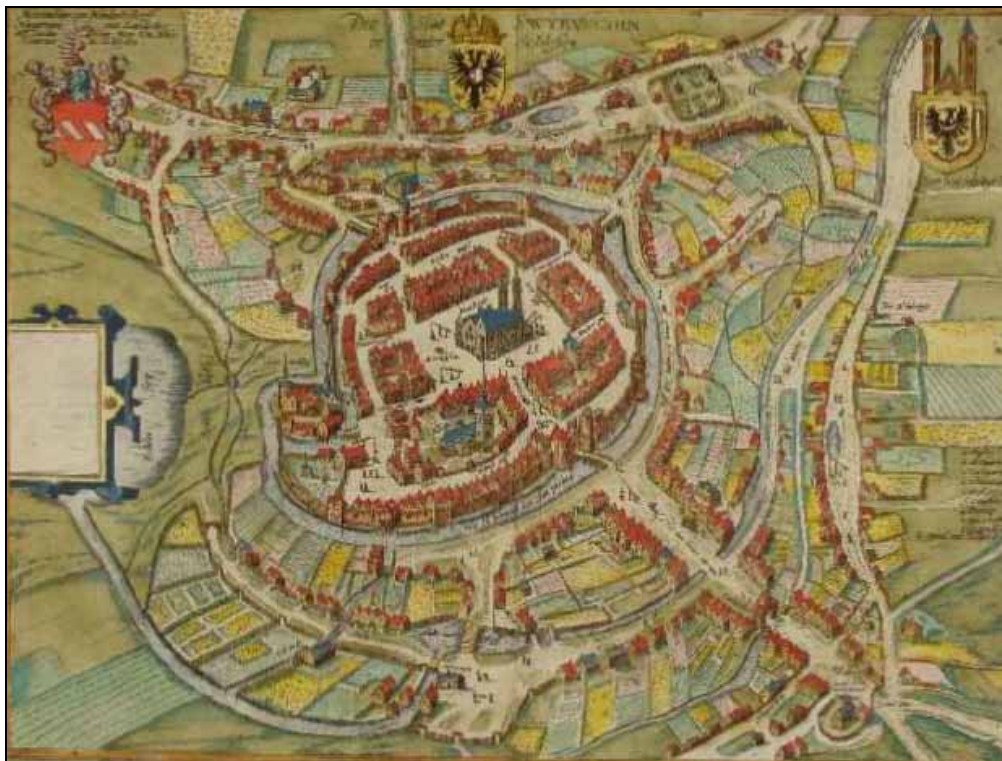
Rys. 1. Plan perspektywiczny Świebodzina pochodzący z t.5 pracy G. Brauna i F. Hogenberga „Urbium praecipuarum mundi theatrum quintum” (fr. wersja „Civitates orbium terrarium”) z 1600 r.

Łągów Lubuski – malowniczo opisany przez Michała Szczanieckiego i Gwidona Chmarzyńskiego „Zamek w Łagowie”, wydana w 1948 roku: „osada na wąskim przesmyku między dwoma jeziorami, garść domów przytulonych do wysokiego zamczyska, którego baszta wznosi się ku niebu, ślady dawnych fortyfikacji, dwie bramy z obu stron przesmyku, jedna „polska”, druga „marchijska”, wskazuje na pograniczne położenie tego grodu” [Szczaniecki, Chmarzyński 1948, s. 4 n.]