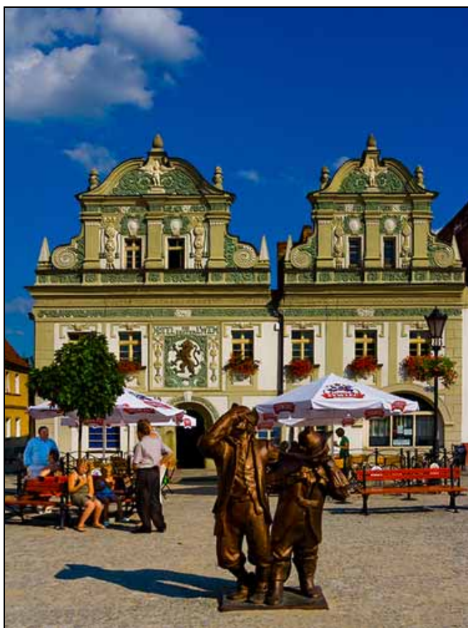
Fot. 2. Bytom Odrzański, „Hotel pod złotym lwem”

rysunki nie mają dużej wartości artystycznej. Jednak ich ogromne znaczenie polega na tym, że przedstawiają wiele budowli, które już nie istnieją lub zostały przebudowane. Stanowią cenne źródło dla historyków sztuki i konserwatorów zabytków.