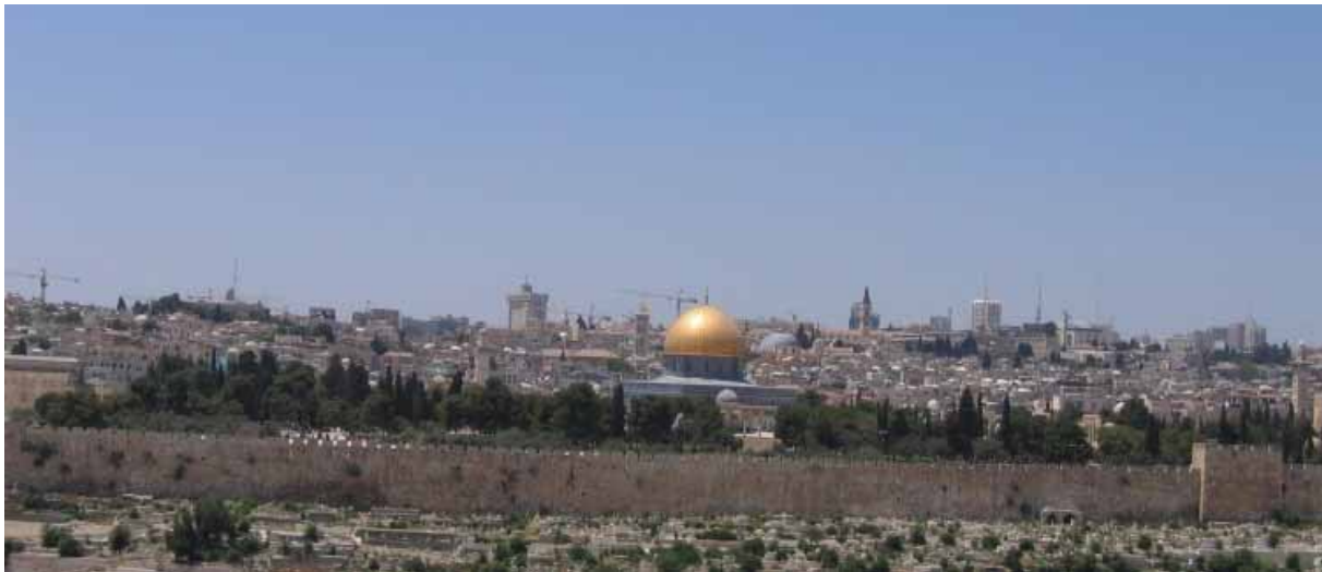
Foto 1. Widok z Góry Oliwnej na Jerozolimę

usatysfakcjonowany z powodu odwiedzin Bazyliki Narodzenia w Betlejem, Grobu Bożego i Drogi Krzyżowej, Ściany Płaczu w Jerozolimie, a także panoramy tego miasta z Góry Oliwnej, którą zna z pocztówek, zdjęć i folderach. Liczba ofert jednodniowych i skala ich wykorzystania świadczy, że ta forma zwiedzania Ziemi Świętej wielu polskim turystom wystarcza.