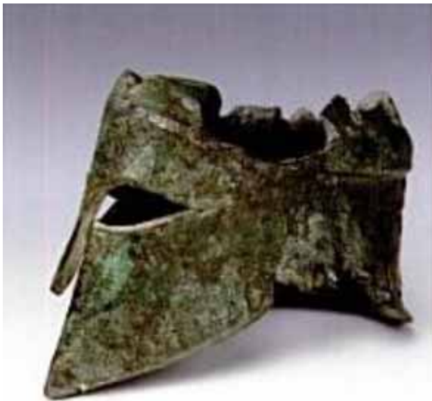
Il. nr 1 Hełm Miltiadesa ofiarowany Zeusowi w Olimpii

(Olimpia. Muzeum Archeologiczne, za N. Yalouris, S. Meletzis, Olympia: Altis and Museum , Monachium 1972, il. 24 c)