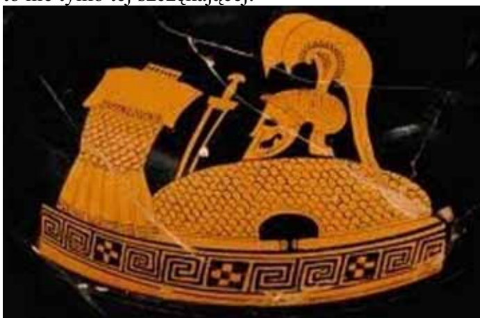
Il. nr 4 Elementy uzbrojenia na czerwonofiguralnej hydrii, ok. 500-400 przed Chr.

Obraz pokoju ( eirene ) to w istocie przedstawienie tarczy, w uchwytach której brunatne pająki snują sieć – jak w peanie Bakchylidesa [IV 10, 4]. Niewątpliwie Pauzaniasz ani żaden podróżnik przed nim nie myślał z odrazą o złotej tarczy złożonej w olimpijskiej świątyni przez Tanagryjczyków jako symbolu ich militarnego zwycięstwa, podobnie jak o dwudziestu jeden połączonych tarczach stanowiących dar rzymskiego wodza, ani wreszcie o złotych tarczach przesłanych na Akropol przez Aleksandra Macedońskiego po bitwie nad Granikiem [V 10, 4-5; I 25, 7]. Tarcze te, wykute z miękkiego metalu, nie służyły nikomu w boju, a zostały wykonane jedynie na pokaz, aby przyszli wędrowcy mogli z podziwem je oglądać i chwalić jej ofiarodawców. W czasach Pauzaniausza broń daleko już „wyszła poza pole bitwy”. Rówieśnik autora Wędrowki po Helladzie – Ksenofont z Efezu, w napisanym przez siebie romansie, każe kochankom złożyć Heliosowi złotą tarczę [ Eph. I 12]. W helleńskiej przestrzeni świątynnej broń gościła począwszy od VIII w. przed Chr., a więc okresu kształtowania się instytucji polis. Choć rytuał ofiarowania bogom oreża nie był wyłączną domeną Hellenów, to jednak dynamika zjawiska pozostaje specyficznym rysem kultury greckiej [Pritchett 1979, s. 240]. Nic zatem dziwnego, że dzieło Pauzaniausza pełne jest broni i to nie tylko tej szczękającej.