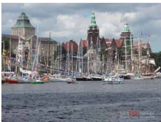
Fot. 8. Tall Ship Races 2007 – Szczecin