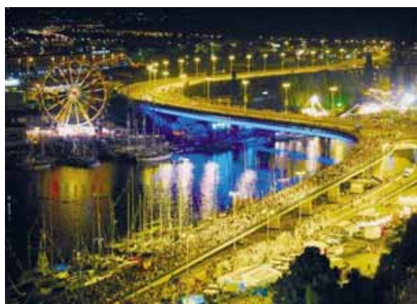
Fot. 9. Tall Ship Races 2007 – Szczecin