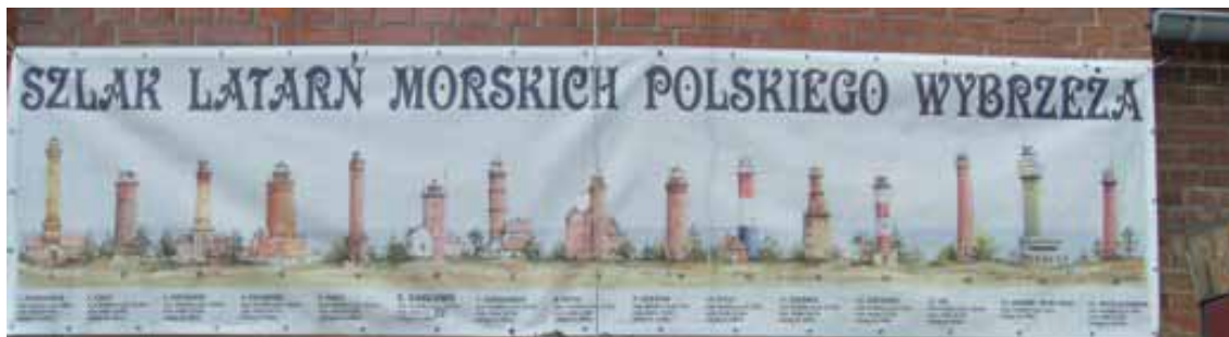
Fot. 6. Banner reklamujący Szlak Latarni Morskich Polskiego Wybrzeża