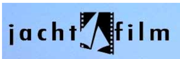
Ryc. 5. Logo festiwalu „JachtFilm”