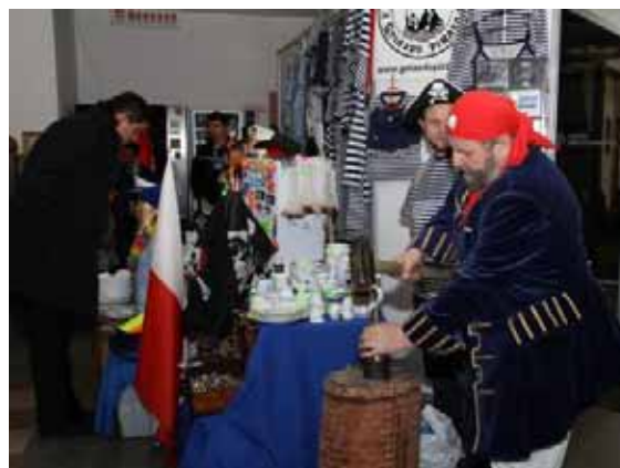
Fot. 12. i 13. Targi Wiatr i Woda – Warszawa 2009