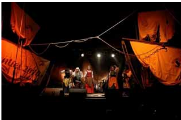
Fot. 10. Festiwal Shanties 2010

Najważniejszym polskim festiwalem piosenki żeglarskiej jest Festiwal „Shanties”, organizowany od ponad 30 lat w Krakowie (fot. 9 i 10). Idea tej imprezy pojawiła się w 1981 roku. Wówczas zorganizowany festiwal miał charakter kameralnego spotkania (20 wykonawców i około 100 widzów) zainicjowanego przez kilku pasjonatów żeglarstwa i szant związanych z Młodzieżowym Klubem Morskim „Szkwał”. By zrozumieć wyjątkowość festiwalu trzeba rozważyć go przez pryzmat historii. Narodziny imprezy w czasie „dziejowej burzy” były wydarzeniem wyjątkowym, dającym sposobność do dobrej zabawy, buforem na rzeczywistość lat osiemdziesiątych. Wszystko to spowodowało, że pierwsza edycja spotkała się z entuzjastycznym przyjęciem publiczności. Festiwal w niedługim czasie stał się imprezą na skalę ogólnokrajową i nie tylko żeglarską, a od 1987 roku także festiwalem międzynarodowym. Koncerty festiwalowe z małej kameralnej sali przeniosły się do CK Rotunda. Festiwal stał się jednym z największych w Europie i zyskał sobie miano najbardziej prestiżowego nie tylko w Polsce, ale i zagranicą, a dla wykonawców nie tylko z Polski udział w nim jest największym estradowym wyróżnieniem [www.shanties.pl].