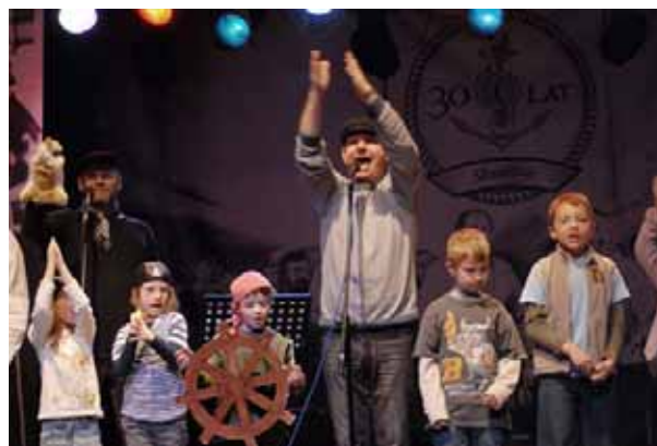
Fot. 11. Koncert dla dzieci Shanties 2011

Poza krakowskim festiwalem, w Polsce istnieje wiele innych okazji do uczestnictwa w koncertach, na których można posłuchać tradycyjnych pieśni marynarzy. Poniżej przedstawiono wybrane propozycje: