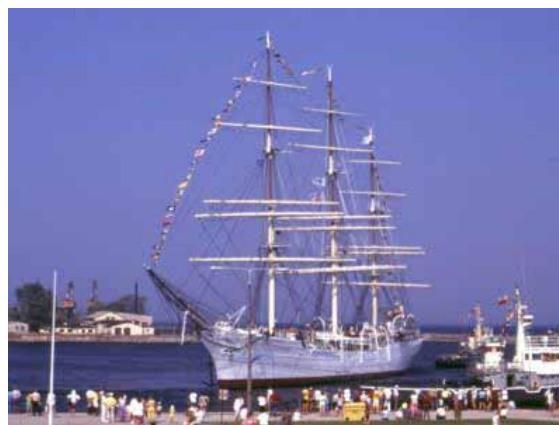
Fot. 3. Żaglowiec Dar Pomorza