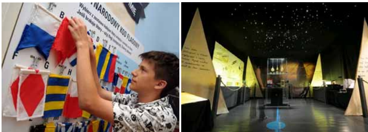
Fot. 4. i 5. Wystawa „Navigare necesse est” – Muzeum Oręża Polskiego w Kołobrzegu