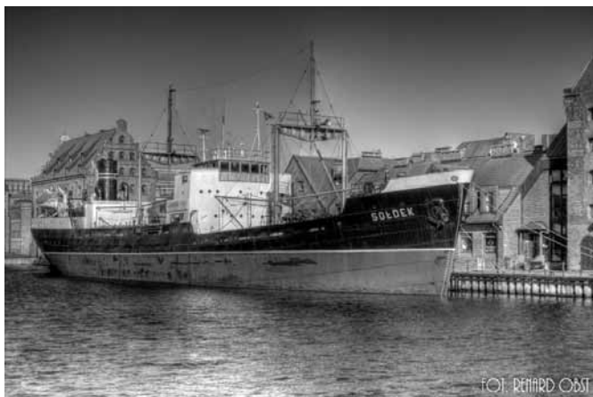
Fot. 1. Statek „Sołdek”

Pierwszym z nich jest muzeum gdańskie, nazwane Centralnym Muzeum Morskim, które za swoje posłannictwo przyjęło „ochronę dziedzictwa nautologicznego poprzez gromadzenie i zabezpieczanie zabytków związanych z żeglugą, szkutnictwem, okrętownictwem, rybołówstwem oraz upowszechnianie wiedzy o nich, a także o morskiej historii Polski i jej gospodarce. Muzeum realizuje swoją misję poprzez prace badawcze, konserwację zabytków, organizację wystaw i uczestnictwo w stowarzyszeniach muzealnych” [www.cmm.pl]. Do najciekawszych eksponatów muzeum należy statek „Dar Pomorza”, który otrzymał swą nazwę w 1929 roku dla upamiętnienia ofiarności pomorskiego społeczeństwa, z którego datków udało się zakupić fregatę. Od 1982 roku statek stał się własnością muzeum. Obecnie znajduje się on w Gdyni. Dla zwiedzających udostępniono m.in. pokład, międzypokład, maszynownię, dziobówkę, kuchnię oraz magazyn żagli. Kolejny statek – eksponat w kolekcji muzeum – to „Sołdek” – pierwszy oddany do eksploatacji w historii polskiego przemysłu stoczniowego statek pełnomorski. Zwiedzając „Sołdka” (fot. 1) mamy możliwość zapoznania się z zabytkową konstrukcją rudowęglowca z pokładem typu szanćowego, czterema ładowniami i nadbudówkami na śródokręciu i rufie.