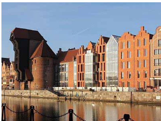
Fot. 2. Ośrodek Kultury Morskiej

oryginalne prezentacje audiowizualne oraz komputerowe wizualizacje. Fot. 2 i 3 przedstawiają Ośrodek Kultury Morskiej oraz żaglowiec Dar Pomorza.