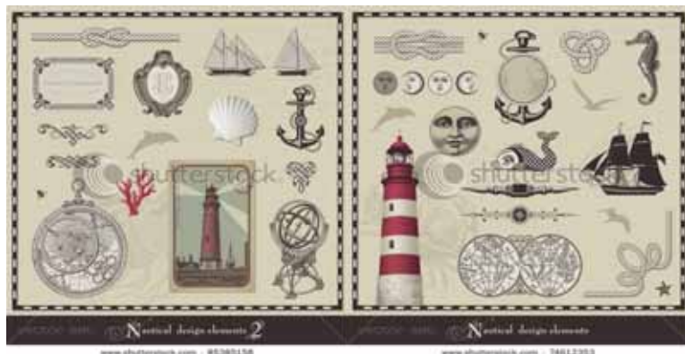
Ryc. 1 i 2. Symbole żeglarskie

Kultura żeglarska była i jest źródłem inspiracji dla wielu artystów. Wśród symboli i motywów przejawiających się w wytworach artystycznych wymienić można m.in.: wzór biało-granatowych pasów z czerwonymi elementami, który stał się kanonem powracającym co jakiś czas na wybiegach najslawniejszych projektantów mody; kotwicę, sekstant, koło sterowe, busole, kompas, wizerunek starych map, węzły, różę wiatrów, latarnię morską, wizerunek żaglowca. Przykładowe symbole kultury żeglarskiej przedstawiono na ryc. 1 i 2.