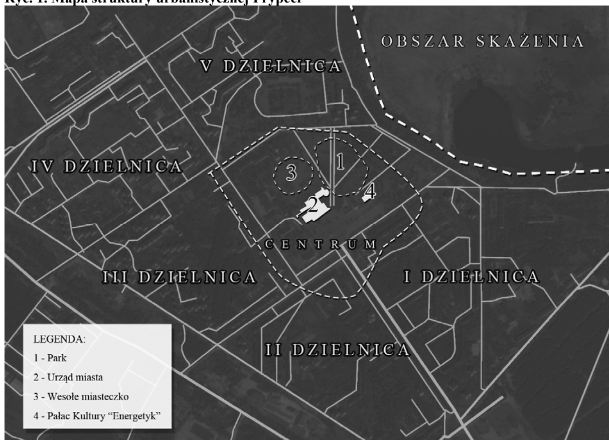
Ryc. 1. Mapa struktury urbanistycznej Prypeci