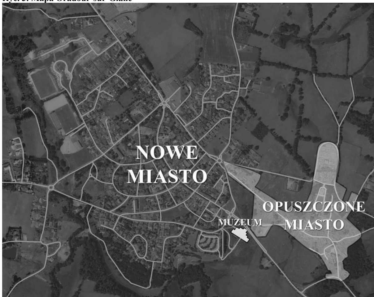
Ryc. 3. Mapa Oradour-sur-Glane