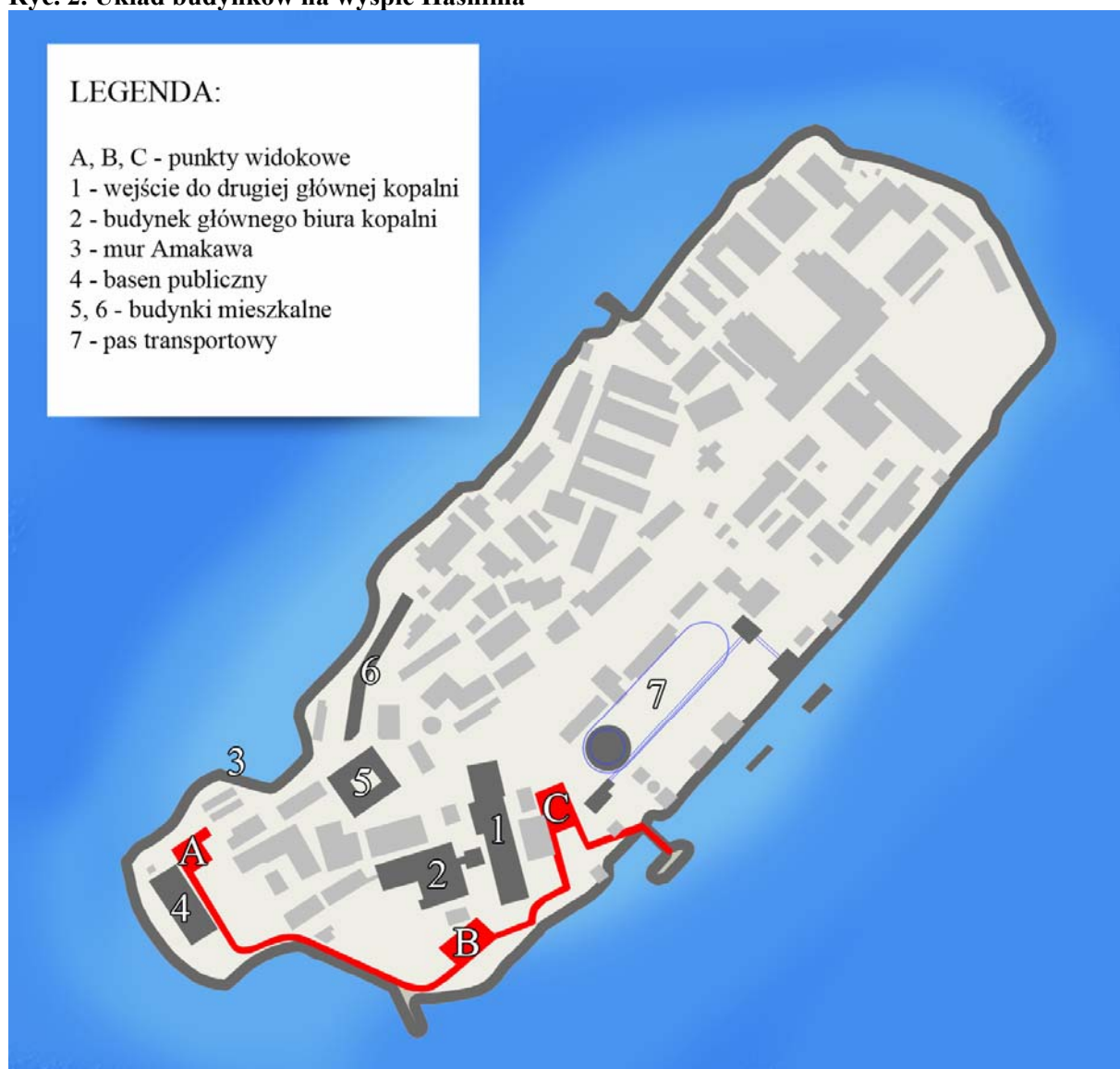
Ryc. 2. Układ budynków na wyspie Hashima