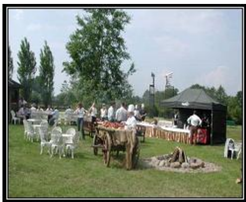
Ryc. 11. Bankiet w plenerze

W lutym 2007 roku oddano do dyspozycji gości DPT w Radziejowicach dwie sale w Nowym Domu Sztuki. Zajmują one powierzchnię 250 i 170 m 2 , co stwarza możliwość organizacji dużych konferencji, koncertów, recitali itp. Sale te rozdziela holl, a w budynku dodatkowo znajdują się również: zaplecze gastronomiczne, sala techniczna, garderoby i toalety.