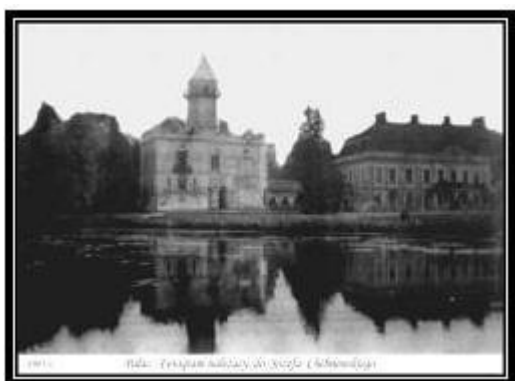
Ryc. 1. Widok pałacu w 1905 r

Ważną inwestycją Józefa i Emilii Krasińskich było wybudowanie kościoła pw. Św. Kazimierza. Zaprojektowany przez Jakuba Kubickiego obiekt zlokalizowano w pobliżu drogi do Mszczonowa.