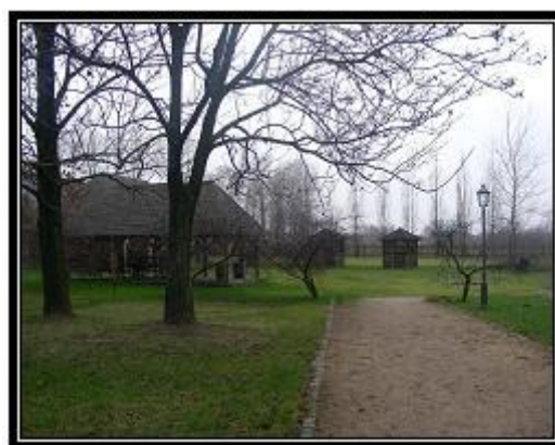
Ryc. 12. Teren piknikowy w DPT

Oprócz organizacji konferencji na terenie założenia pałacowo-parkowego przygotowuje się, zgodnie z życzeniami klientów, bankiety i pikniki (ryc. 11). Od kilku lat funkcjonuje także profesjonalnie przygotowany teren piknikowy (ryc. 12) zlokalizowany w pobliżu Dworku modrzewiowego. Na kompleks składają się: dwie wiaty, dwie drewniane altany i stanowisko grillowe. Atutem jest fakt, iż teren jest nagłośnieony i częściowo oświetlony. Daje to możliwość organizacji pikników i przyjęć w plenerze liczących od kilku do kilkuset uczestników, niezależnie od warunków pogodowych.